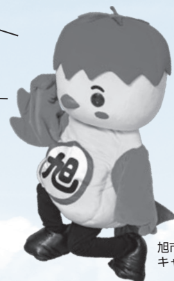
旭市イメージアップ キャラクター「あさひ餅」