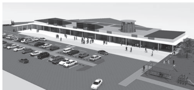
「道の駅」完成イメージ

道路利用者などのための休憩施設、また「食の郷旭市」の推進や地域活性化なども目的とする道の駅。平成27年度中の開業を目指し、施設整備事業を進めています。