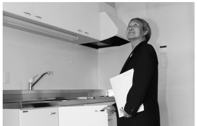
室内を確認する入居者

東 日本大震災で被災し、住宅の再建が困難な人が入居する災害公営住宅が仮設住宅飯岡の南側に完成。その住宅入居者への鍵引き渡し式が4月2日、飯岡保健センターで行われました。この日、鍵を受け取った入居者は、早速、室内を確認したり荷物を運び入れたりしていました。