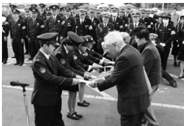
交通安全を願う手紙を贈る子どもたち

街頭では交通安全関係団体などが啓発物の配布を行い、交通事故防止を呼び掛けていました。