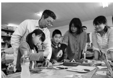
指導員や保護者と一緒に工作

こまが作られました。完成したこまを回す子どもたち。「よく回った」「楽しかった」などと笑顔を見せていました。