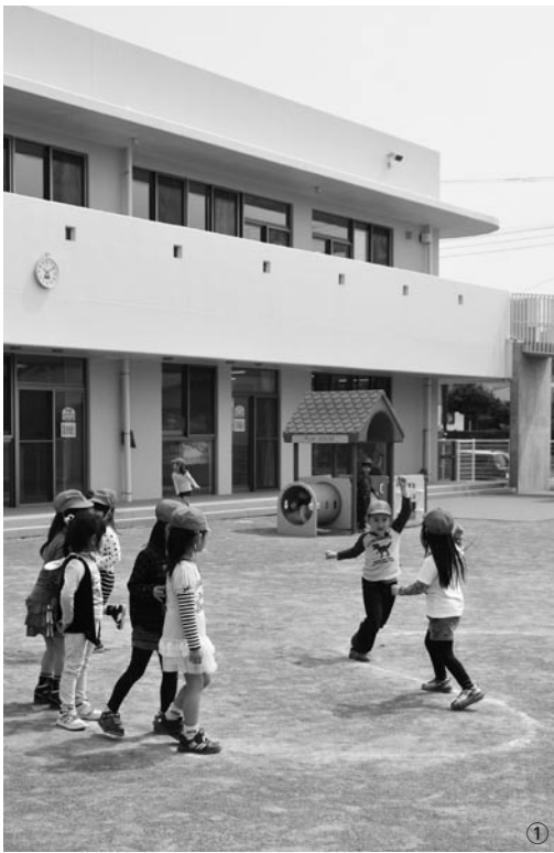
①新しい保育所の庭で遊ぶ子どもたち ②子どもたちも参加した開所式(4月2日)

建物は鉄筋コンクリート造り2階建てで、延べ床面積992.19㎡。津波に備え外階段やスロープを設け、屋上(海拔14.6m)は300人が避難できるようになっています。