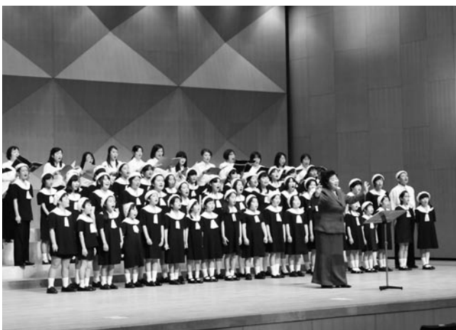
フィナーレは会場全体に呼び掛けて合唱

この日子どもたちはホールに歌声を響かせたほか、ダンスなども披露。それに合わせて来場者のリズムを取ったり、笑顔で見つめたりする姿がありました。またフィナーレには出演者全員が舞台上がり、来場者と共に復興支援ソング「花は咲く」を歌い上げていました。