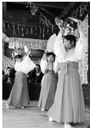
華やかな衣装を身にまとった稚児舞(熊野神社の神楽)

熊野神社の神楽が清和乙にある境内で3月21日、鎌数の神楽が3月27日と28日に鎌数伊勢大神宮で、地域の平穏や五穀豊穡 ほろじょう などを願い奉納されました。