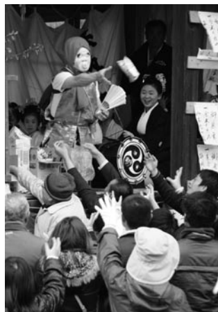
訪れた人たちに菓子 うけもち をまく保食の神(鎌数の神楽)