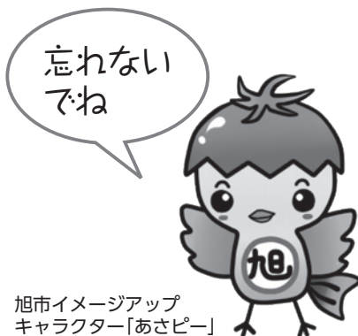
旭市イメージアップキャラクター「あさピー」