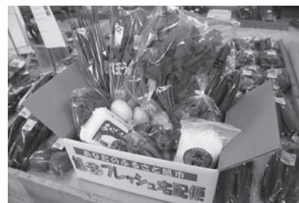
旭の味覚がぎゅーしり