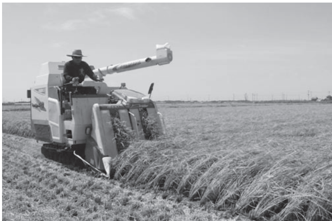
干潟八万石での稲刈り