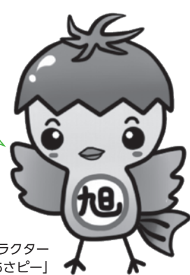
旭市イメージアップキャラクター「あさぴー」