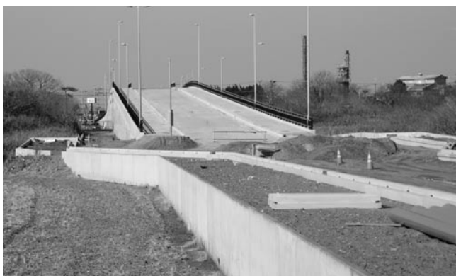
整備が進む谷丁場遊正線