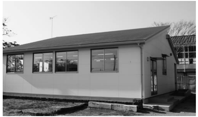
新築の放課後児童クラブ室(共和小)