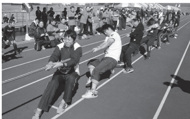
スポーツで深まる絆「旭市民体育祭」

専門のトレーナーを配したトレーニングルーム(総合体育館)および各種スポーツ教室を開設する。