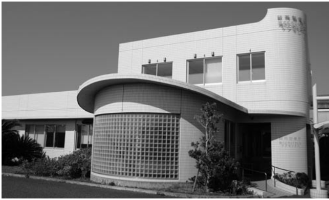
休日救急診療が行われている旭中央病院附属飯岡診療所