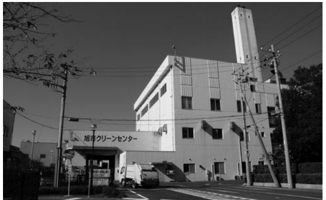
旭市クリーンセンター