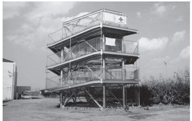
津波避難タワー(三川地区)

津波避難タワーや防災備蓄倉庫の設置など災害に強い地域づくり事業、被災者の住宅の安定確保を図る災害公営住宅整備事業や仮設住宅管理費、復興に向けた市街地液状化対策事業、津波からの避難道を整備する津波避難道路整備事業、津波被害の軽減を図る減災林整備事業など 災害に強い地域づくり事業 …………… 140,416千円 震災の被害を踏まえ、復興計画における災害に強い地域づくりを推進するための防災体制を整備する。 「がんばろう！旭」復興支援事業 …………… 21,520千円 復興への機運を高める新たな復興イベントを開催するとともに、各種団体が行う復興事業に対し補助などを行う。 災害公営住宅整備事業 …………… 12,591千円 震災により住宅を失った被災者の居住の安定を図るため、災害公営住宅を整備する。 合併処理浄化槽設置促進事業 …………… 31,600千円 生活排水による公共用水域の水質汚濁を防止するため、合併処理浄化槽を設置する人や、震災で被害を受けた浄化槽を更新する人などへ補助金を交付する。 災害廃棄物処理事業 …………… 49,000千円 震災で被害を受けた住宅の解体や修繕により、発生した災害廃棄物を速やかに処理する。 商工業災害復旧資金利子補給事業 …………… 3,139千円 震災により被災した中小企業の負担軽減を図るため、借り入れた資金に対し利子補給を行う。