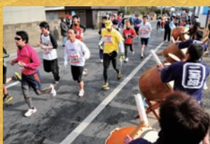
7位 / 旭市飯岡しおさいマラソン