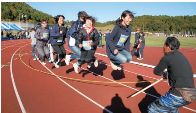
笑顔が連なるロープジャンプ

市内15の小学校区で競い合う採点種目と、子どもからお年寄りまで参加できるオープン種目のほか、飯岡中や干潟小による吹奏楽、地元アスリートの模範演技、お囃子なども行われ、参加選手たちや声援を送る観客たちに、たくさん笑顔が見られました。