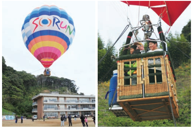
3階建ての校舎より高く上昇。笑顔の児童

学習成果の発表などをして、保護者や地区住民との交流を図る、中和小のすずがね祭りが11月17日に開かれ、熱気球の搭乗体験が行われました。