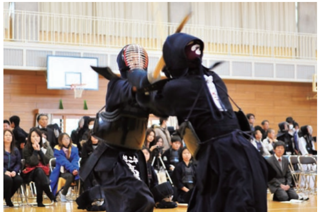
「めーん」1本が決まる

青少年の健全育成を目的に剣道大会が12月1日、二中体育館で開催され、12団体136人が参加しました。各部門の優勝は以下のとおり。 ※敬称略