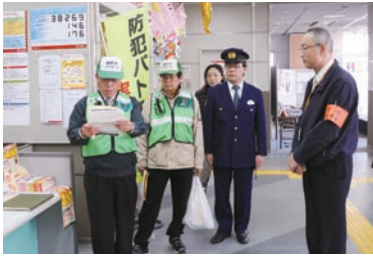
事業所への協力要請活動(旭郵便局)

「自分たちのまちは、自分たちで守ろう」を合言葉に、旭市エンジンパトロール隊が、集団防犯パトロールを行いました。市役所での出発式の後、小学校区ごとに別れ、事業所や道行く人たちにチラシを配布するなどして、注意を呼び掛けていました。