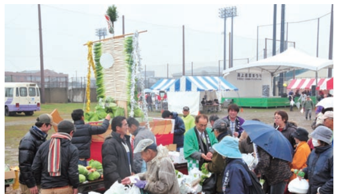
海上会場だけの「野菜宝船」の即売会には人だかり