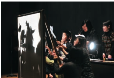
影絵に挑戦する子どもたち

東総文化会館で、中央小お話ボランティア・旭地域お話し会による「ちばなし〜ちばの昔話・かげ絵〜」が、開催されました。富津市の昔話「かっぱのおんがえし」の影絵上演、子どもたちの影絵体験する姿などに、訪れた人のたくさんの笑顔がありました。