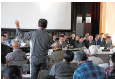
質問や要望が相次ぐ会場

海岸減災林の整備や避難施設などの複合的な津波対策に関する説明会が、飯岡保健センターと矢指小で行われました。