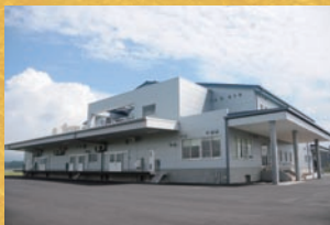
4位 / 旭市第二学校給食センター