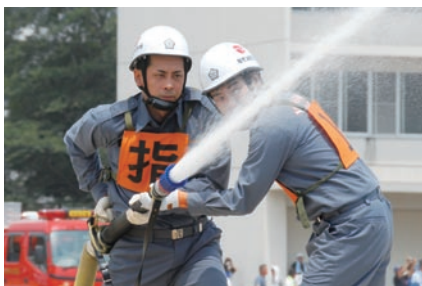
精鋭たちのりりしい姿

対象／市内在住・在勤で健康な18歳以上の人 岡消防本部総務課消防団班(☎63-5355)