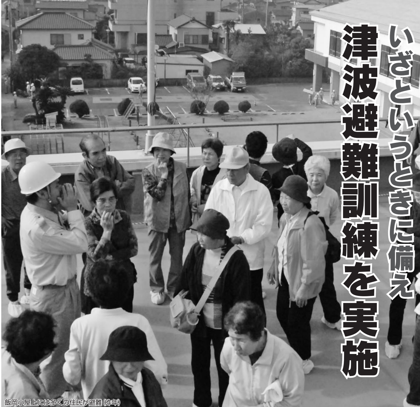
飯岡小屋上には多くの住民が避難(昨年)