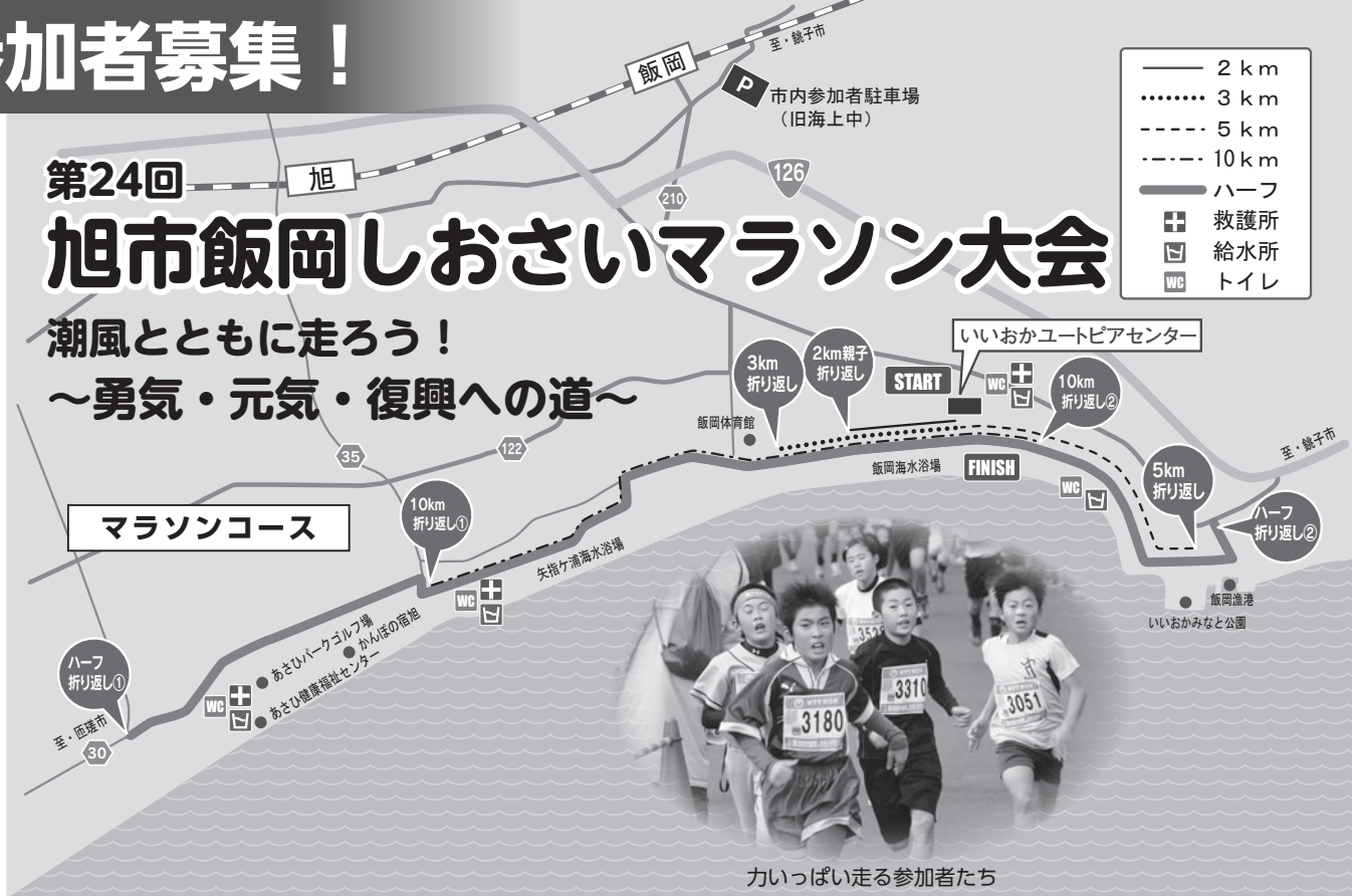
力いっぱい走る参加者たち