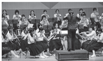
心のこもった演奏の数々