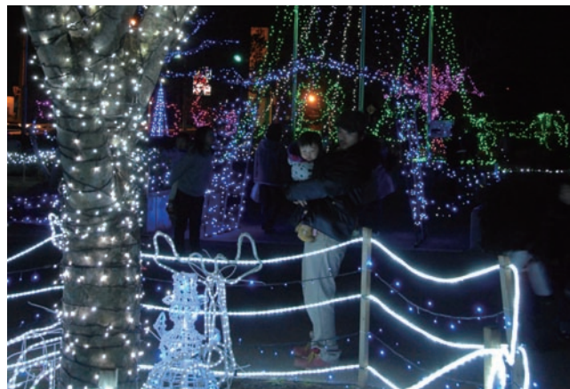
色鮮やかな光の演出に足が止まります(12月18日)

光が織り成す演出で、毎年多くの人を魅了する冬の風物詩「スターライトファンタジー」。この光の祭典が商工会青年部により、12月4日～24日の間、海上公民館前広場で開催されました。期間中は、毎日午後5時になると点灯、光のオブジェの前では、訪れた人たちが記念撮影をしたり、見入ったりする姿がありました。