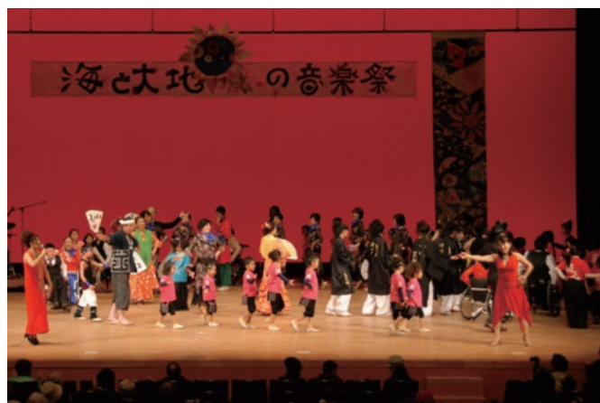
会場が一つになりました

東 日本大震災からの復興と被災者の支援のため、飯岡まちおこし実行委員会が12月18日、東総文化会館で海と大地の音楽祭を開催しました。会場を訪れた人たちは、歌や踊り、太鼓にマジックと、次から次へと繰り広げられるステージイベントの数々を大いに楽しんでいました。また大震災津波記録パネル展も同時開催され、震災写真を興味深そうに見入る人の姿がありました。