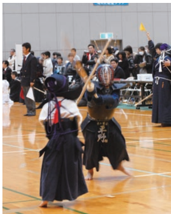
どの試合も気合十分！