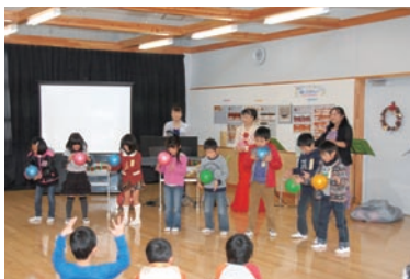
音楽に合わせて遊ぶ児童たち

児童たちに音楽を身近に感じてもらうと、矢指小の新校舎で、地元の音楽団体「アンサンブルFAMI」がコンサートを行いました。音楽に合わせて体を動かす遊びや、クリスマスにちなんだスライド音楽劇などの上映もあり、児童たちからは笑顔があふれていました。