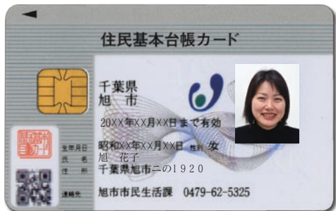
顔写真付き住基カード(見本)