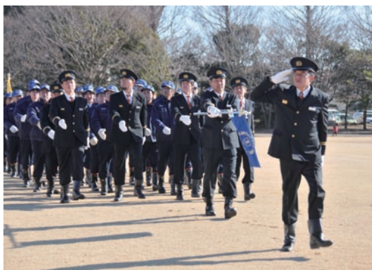
精鋭たちの気合の入った行進

※第1・2中隊＝旭地域、第3中隊＝海上地域、第4中隊＝飯岡地域、第5中隊＝干潟地域