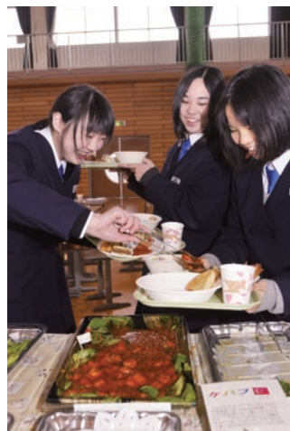
特別メニューに笑顔(干潟中)

干潟中では、生徒たちが机と椅子を持って体育館に移動。ケバブやエビのチリソースなど、世界各国の料理23種が並び、皆「おいしい」と頬張っていました。またこの日は、普段は顔を合わすことのない栄養教諭と調理員が訪れていて、生徒から「将来、学校の先生になって戻ってくる。そして、また給食が食べたい」と声を掛けられる場面もありました。最後は生徒たちから、その栄養教諭らに感謝の言葉が贈られ、大きな声の「ごちそうさまでした！」が、体育館に響き渡りました。