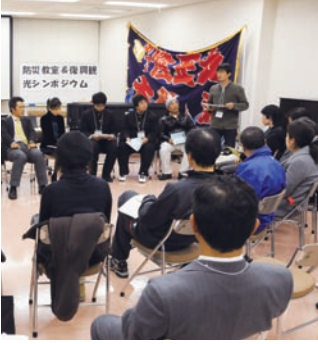
さまざまな活動が行われています