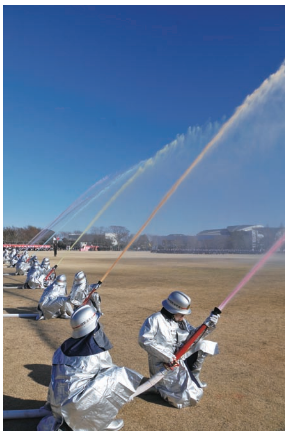
色鮮やかな放水が青空に映える

またこの日は、長年消防活動に尽力されるなどの功績をたたえ、153人に表彰状や感謝状が贈られました。主な受賞者は次のとおり。※敬称略