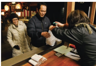
手に入れ、笑みがこぼれます

西宮神社の春の大祭が行われ、みそと唐辛子、ゴボウなどを練り合わせた縁起物「とがらごぼう」を求める人で、長蛇の列ができました。一番乗りは、前日の午後11時30分に