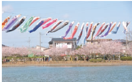
袋公園桜まつりの鯉のぼり