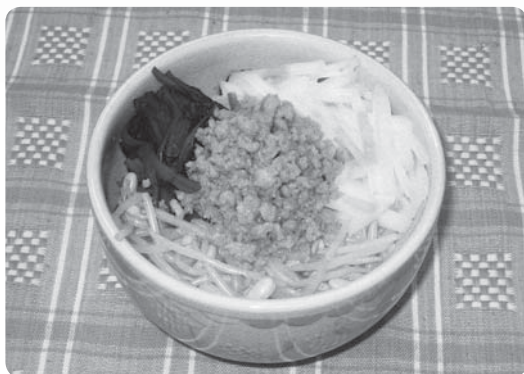
栄養価1人分 エネルギー405kcal、塩分1.0g