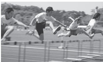
去年の市民陸上競技大会