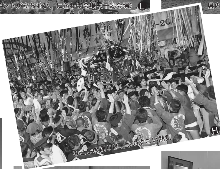
みこしの周りは、ものすごい熱気