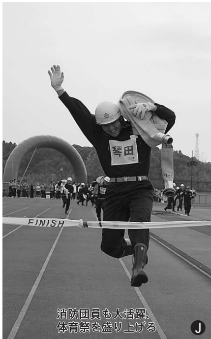
消防員も大活躍、 体育祭を盛り上げる