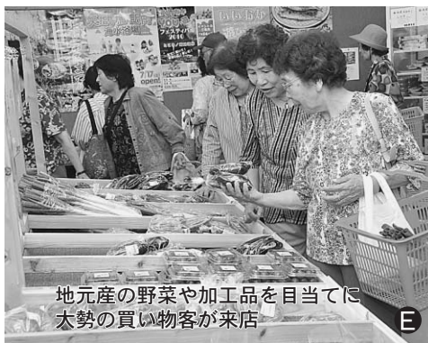
地元産の野菜や加工品を目当てに太勢の買い物客が来店