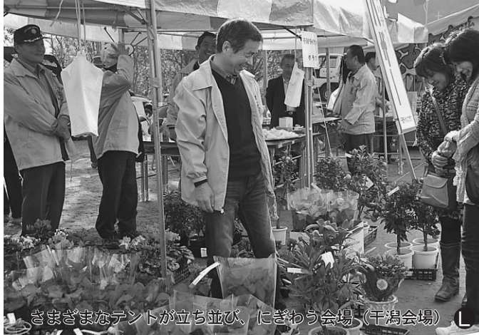
さまざまなテントが立ち並び、にぎわう会場（干潟会場）