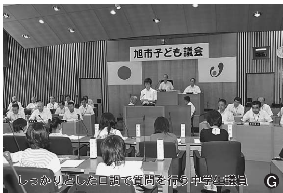
しっかりとした口調で質問を行う中学生議員