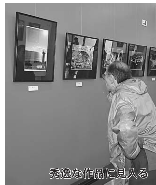
秀逸な作品に見入る