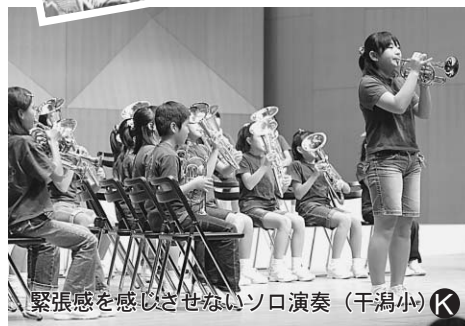
緊張感を感じさせないソロ演奏（干潟小）