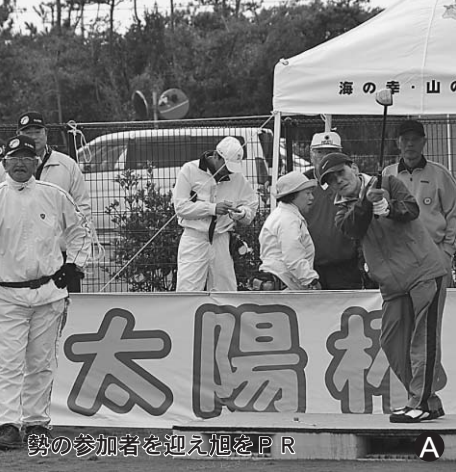
勢の参加者を迎え旭をPR