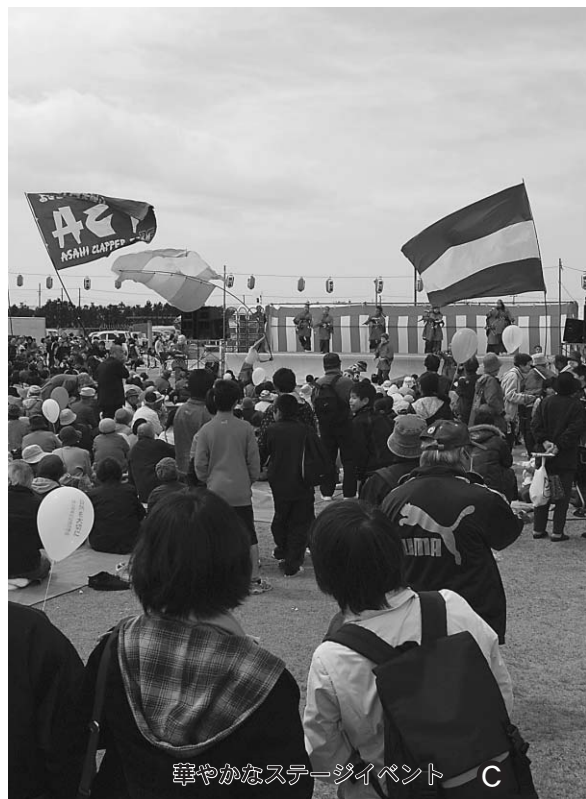
華やかなステージイベント