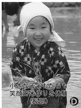
小さな子どもたちも笑顔で米作りを体験(長部)