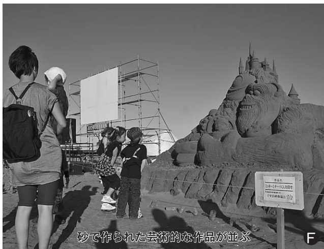
砂で作られた芸術的な作品が並ぶ