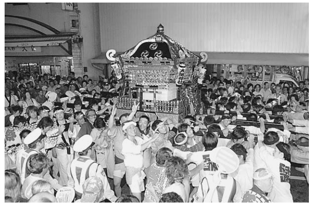
▲昨年の七夕市民まつり

みこしや踊り、お囃子など七夕市民まつりを盛り上げてくれる団体を募集します。 日時／8月6日(金)：みこし、お囃子 7日(土)：踊り、お囃子、ダンス、仮装パレードなど 両日とも午後5時30分～10時 ※申し込み多数の場合、参加日などを調整することがあります。 場所／旭市中央商店街パレードコースなど 申込期限／7月1日(木)