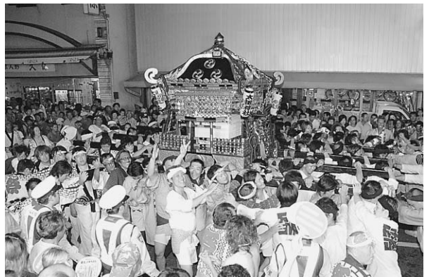
▲昨年の七夕市民まつり

みこしや踊り、お囃子など七夕市民まつりを盛り上げてくれる団体を募集します。 日時 ／8月6日(金)：みこし、お囃子 7日(土)：踊り、お囃子、ダンス、仮装パレードなど 両日とも午後5時30分～10時 ※申し込み多数の場合、参加日などを調整することがあります。 場所 ／旭市中央商店街パレードコースなど 申込期限 ／7月1日(木)