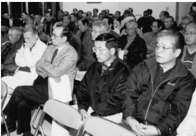
▲旭市エンジョイパトロール隊発足式（青年の家・2月）