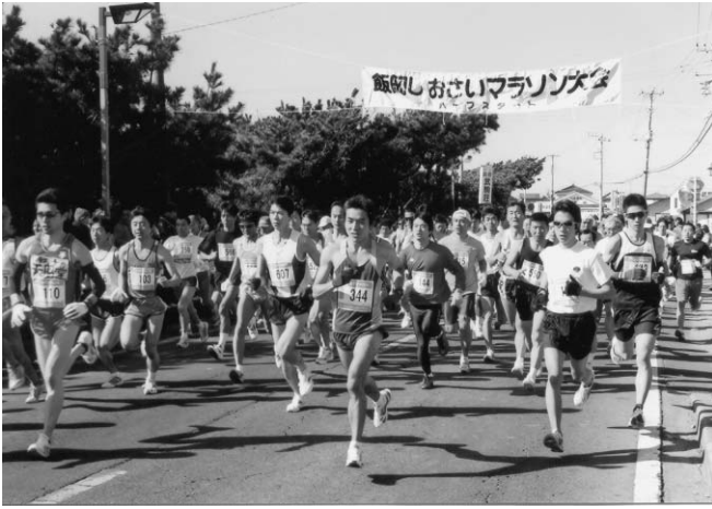
▲飯岡しおさいマラソン大会（2月）