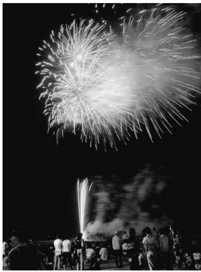
▲いいおかY.O.U.遊フェスティバル（7月）