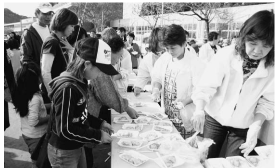
▲ふるさとまつり・ひかた2005（干潟中・11月）