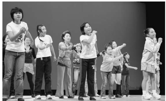
▲市民創作ミュージカル「光を感じて」-（東総文化会館・11月）