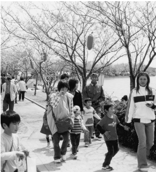
▲袋公園桜まつり（4月）