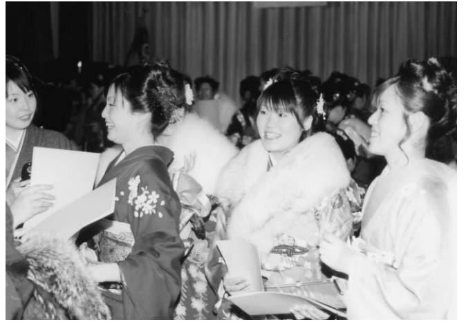
▲成人式（海上町・1月）