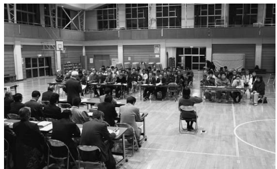
▲地区懇談会（豊畑小体育館・11月）