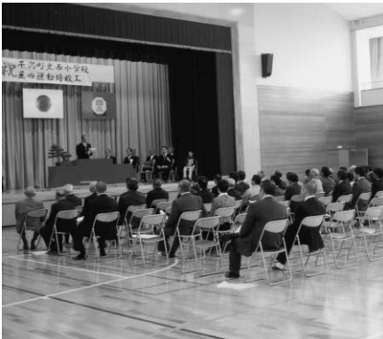
▲干潟町立西小学校体育館竣工（4月）