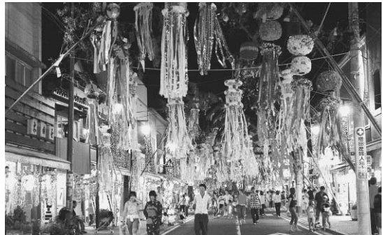
▲七夕市民まつり（8月）