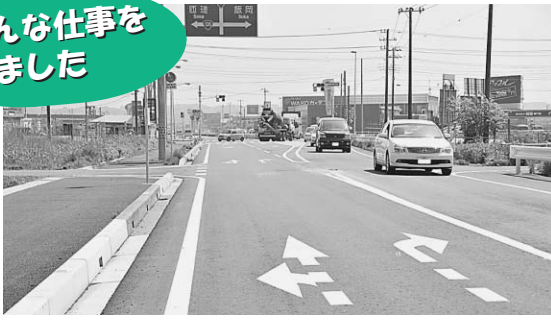
▲中央病院アクセス道東西線