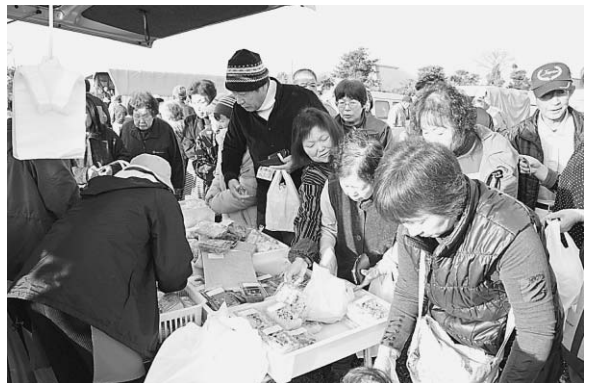
▲次々と競うように農産物や加工品に手を伸ばす来場者

毎週日曜日に朝市を開いている海上のかあちゃん市が4月18日、創立18年目を迎えたことを記念してイベントを開きました。