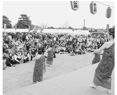
▲ステージを見入る大勢の人たち