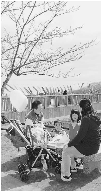
▲桜の下で食べるご飯はいつもよりおいしいね