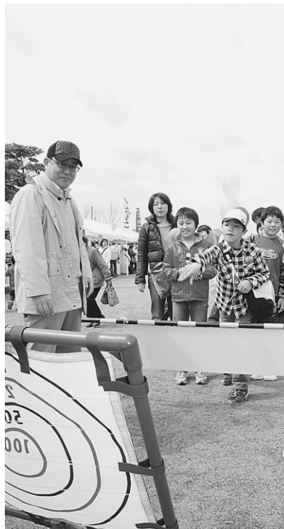
▲よぉーく狙って的に当てて！