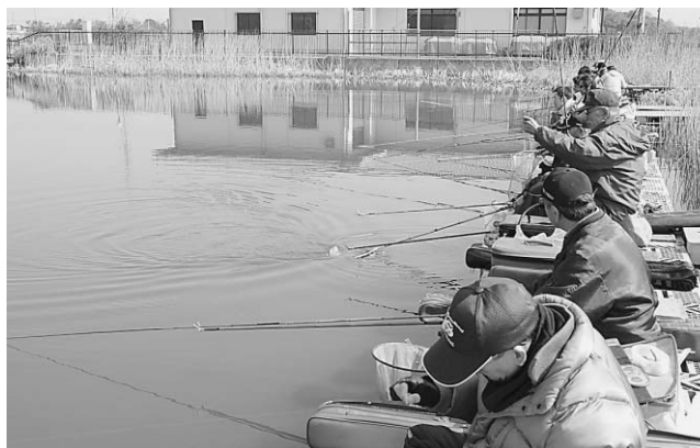
▲勝負は一瞬！あっという間に釣り上げました

4月18日、恒例のフナ釣り大会が行われました。数日前から冷たい雨が続き、天候が心配でしたが、この日は晴天となり、市内外から154人が参加しました。早朝から池を囲んだ太公望たちは、一瞬のタイミングを逃すまいと、水面のウキに集中。勝負に敗れたフナは、腕自慢の太公望たちに釣り上げられていました。