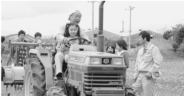
▲初めて乗るトラクターにドキドキワクワク

8回目となる「菜の花まつり」が4月10日、蛇園地区還来寺周辺の畑で開催されました。今年は、菜の花の成長がやや遅く、満開までもう少しでしたが、たくさんの方が訪れ、模擬店やイベントを楽しんでいました。また、虫かごや網を持った子どもたちは、菜の花畑で虫を捕ったり、近くの水路で魚をつかまえたりと休日を満喫していました。菜の花は、ゴールデンウィーク中も楽しめそうです。