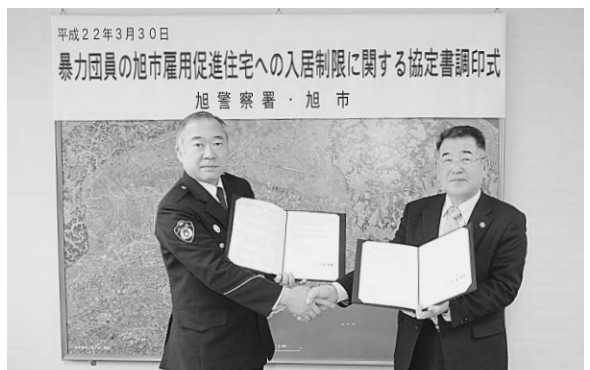
▲協定を結んだ市（右）と旭警察署長（左）

調印式では、市長と署長が協定書にサインをした後、互いが連携して暴力団を排除することを堅い握手で誓い合いました。