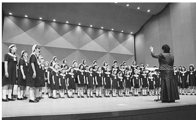
▲きれいなハーモニーが会場に響く