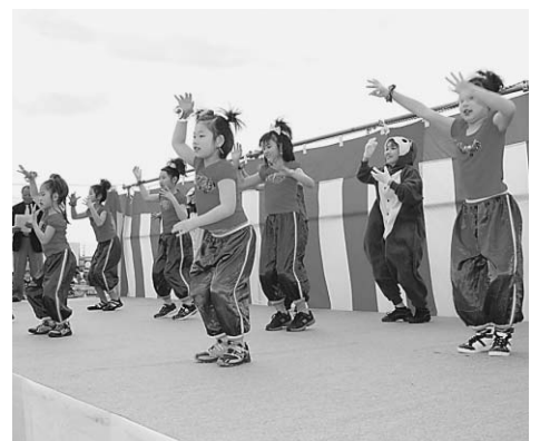
▲子どものダンサーたちが会場を盛り上げる