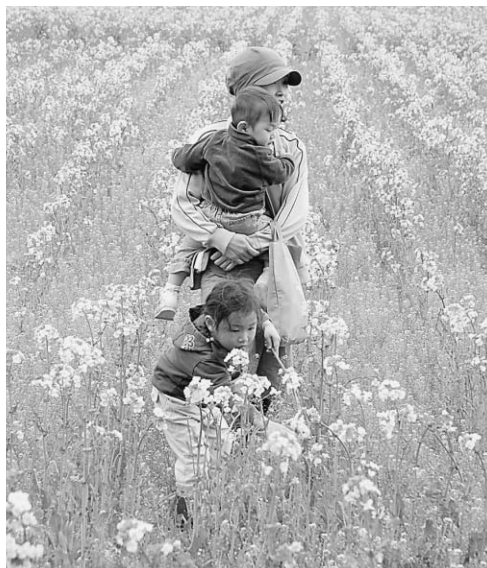
▲あっ、てんとう虫 見つけた