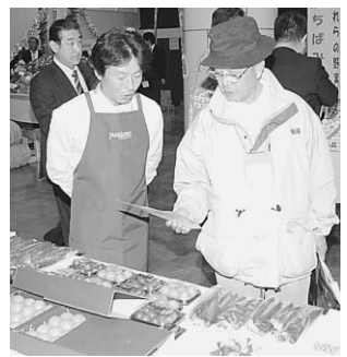
▲自慢の農産物を丁寧に説明する生産者

東京都立産業貿易センターで3月24日、「フレッシュフード海匠見本市」が開催され、生産者などが自ら市場関係者や食品産業関係者などに、旭市の農畜産物などをPRしました。会場を訪れた人たちは各ブースを回りながら、生産者の説明に耳を傾け、気に入った農産物などに次々と手を伸ばして試食をしたり、興味ある商品を見つけると積極的に名刺交換をしたりしていました。