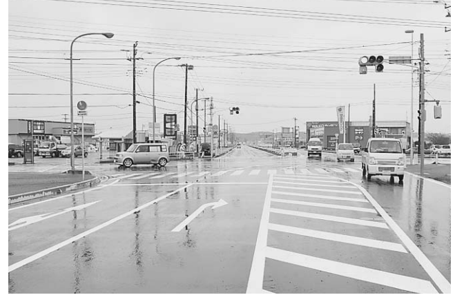
▲飯岡バイパスへと接続するアクセス道東西線

合併後整備が進められてきた、飯岡バイパスから中央病院への新しいルート（アクセス道東西線）と、中央病院から県道銚子旭線までの（アクセス道南北線）の2つの路線が3月29日、開通しました。当日はあいにくの雨となってしまいましたが、午前9時20分に飯岡バイパスとの交差点のバリケードが一斉に取り除かれると、完成したばかりの道路を多くの車両が通り抜けていきました。この2路線の完成で、中央病院への良好なアクセスと付近の渋滞緩和が期待されています。