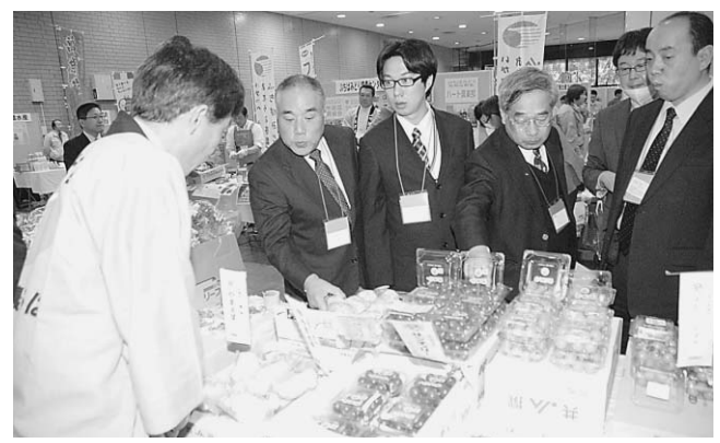
▲並べられた農産物を興味深そうに手に取る来場者