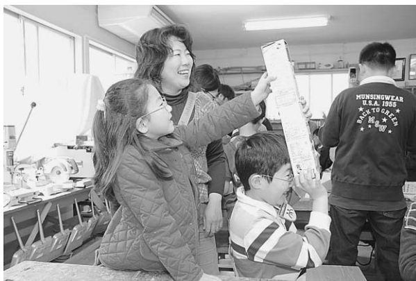
◀親子で製作した潜望鏡 何が見えたかな

今年で28年目を迎える旭少年少女発明クラブの開始式が、4月18日、発明クラブ工作室で行われ、市内の小学校3年生から中学校1年生19人が、第28期生として、活動をスタートさせました。開始式の後に行った工作では、まだ馴れない手つきながらも、今年の発明品第1号、牛乳パックと鏡を使った潜望鏡を完成させていました。子どもたちは、早速、発明の楽しさ、創作する喜びを体感したようです。