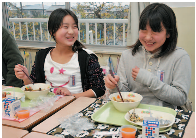
▲笑っちゃうくらい、おいしい！

第4回全国学校給食甲子園で千葉県代表に選ばれた第1学校給食センターの給食が12月11日、同センター管内の小中学校に登場し、子どもたちが味わいました。地元産の食材24品を使った献立は、栄養を考え、おいしく食べられるように工夫されたもの。厚めの平打ちにし、汁が絡みやすくした旭の米粉うどんは「もちもちしておいしい」、野菜を細かくし、豚挽き肉などと混ぜて蒸したつばき蒸しも、「あまり野菜が好きじゃないけど、これは食べられる」など、子どもたちの評判も上々でした。