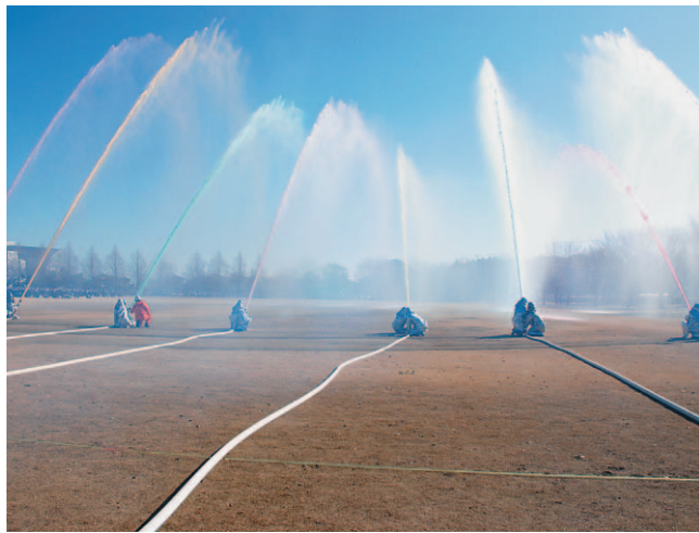
▲色とりどりの放水が青空に映える

なお、長年消防活動に尽力された173人と、消防技術の向上に貢献された4部に、表彰状や感謝状が贈られました。主な受賞者は次のとおりです（敬称略）。