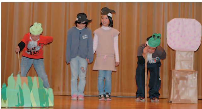
▲年離れたカエルとオタマジャクシを熱演する子どもたち（滝郷小）

環境にやさしい循環型の農業を推進しようと、消費者団体や農業関係団体、行政などが組織するサンライズプラン推進協議会が12月9日、干潟公民館で冬の交流会を開催しました。交流会では今年度市内の農地で生き物調査を行った滝郷小、干潟小の4年生57人が、春、夏、秋それぞれの季節に行った調査結果を発表。気温の変化によって動植物の生活も変わっていくことなどを、壁新聞や劇で楽しく丁寧に説明していました。