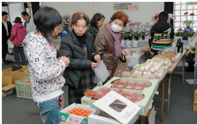
▲旭産の新鮮な野菜や花などがずらりと並ぶ

調理教室に参加した親子は、炊飯器を利用して作った米粉のケーキの出来栄に「おいしそうにできたね」と、満足そうでした。