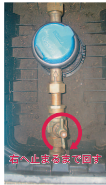
右へ止まるまで回す

○水道を使っていないのに、溝や排水路に排水している。 ○水洗トイレを流していないのに、水が流れている。