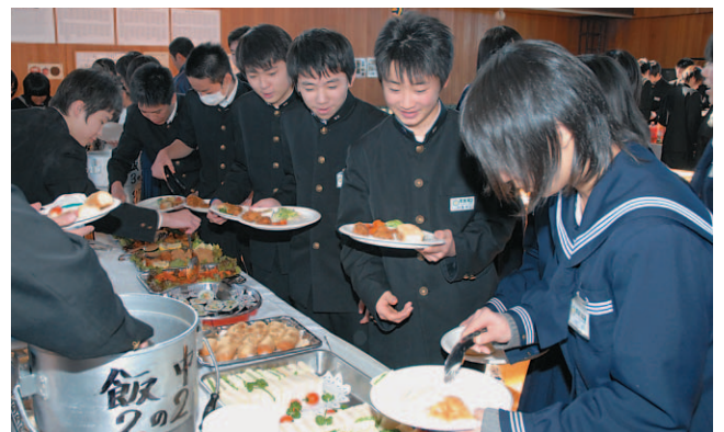
▲待ちきれない様子で順番を待つ生徒(飯岡中)

9年間親しんできた給食も今年度で最後となる中学3年生に、いつもと違った給食を楽しんでもらおうと12月21日、各中学校でバイキング給食が行われました。生徒たちは、テーブルの上に並べられた主食、副菜、デザートなど、30種類の料理から自分の好きなものを皿いっぱい盛ると、「大食い選手権みたい」とおいしそうにほおばっていました。食後には生徒の代表が「栄養を考えたながら、私たちの好きなものを作ってくれてありがとう。おかげで健康に育つことができました」と給食センターの職員に感謝の気持ちを述べていました。