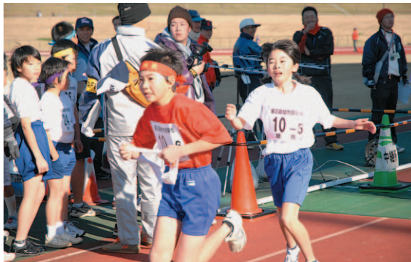
▲仲間からのタスキを受け、勢いよく走り出す選手

さわやかな冬晴れに恵まれた12月20日、市民駅伝大会が東総運動場をスタート・ゴールに行われました。今年は99チーム907人が参加。インフルエンザなどの影響で4チームが当日棄権となってしまいましたが、参加した選手たちは元気にタスキをつなぎ、スタンドや沿道からも「がんばれ、ファイター」など、大きな声援が送られていました。各部門の優勝チームは次のとおりです。 小学生の部（6区9.5km）／網戸スターズA（35分48秒） 中学生の部（7区17.4km）男子／旭一中A（59分3秒）女子／旭二中（1時間8分49秒） 一般の部（7区17.4km）男子／TEAM旭2ユナイテッド駅伝小僧（58分58秒）女子／タートルズ「女組」（1時間22分41秒）