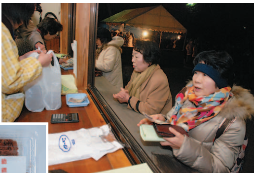
◀次々と配られる、とがらしごぼう

1月18日の早朝、西宮神社で春の大祭が行われ、参拝者に「とがらしごぼう」が配られました。毎年恒例のこの行事、日の出前にもかかわらず多くの人々が列を成していました。先頭の、後草から来た男性は「毎年楽しみにしている。午前2時くらいから並んでいるけど、楽しみにしていたから苦にならない」と、張り切っていました。用意された大小12,000パックのとがらしごぼうは、次々と参拝者に渡されていました。