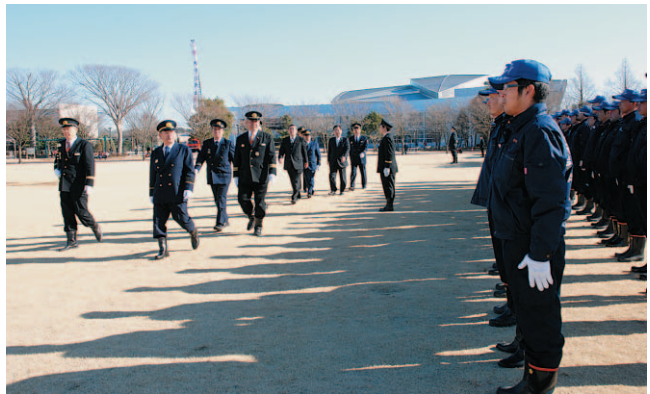
▲人員・服装点検を行う市長ら