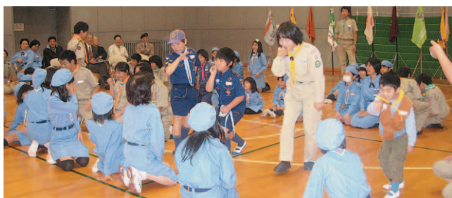
▲歌やゲームなど楽しい時間を過ごしたスカウトたち

▲マッサージを受けながら談笑しようとする気持ちを育てようといわれたもので、今年で9年目。訪問を受けたお年寄りは、「楽しい時間を過ごすことができた」と笑顔を見せていました。