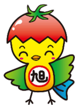
旭市イメージアップキャラクター 「あさびー」