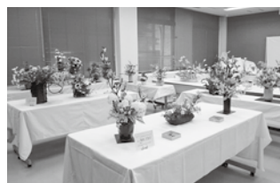
昨年の展示状況(書道)と(華道)