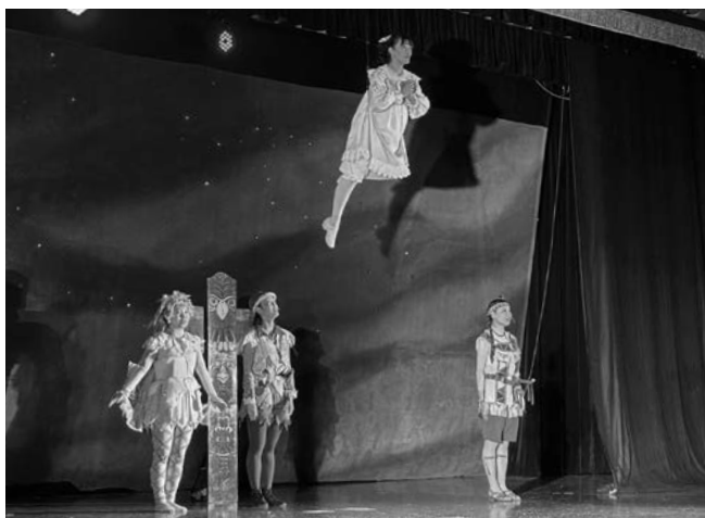
ネバーランドから帰ろうとするウェンディ

舞台は、16曲のミュージカルナンバーと迫力ある演技に、観客みんなが夢中になりました。