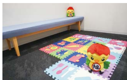
個室となっている親子傍聴席