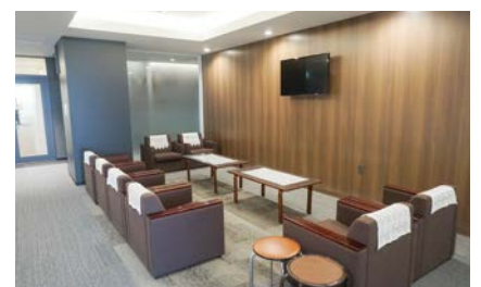
傍聴ロビーでも議会を視聴可能