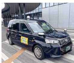
増車した区域外運行車両