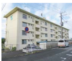
改修された双葉団地A