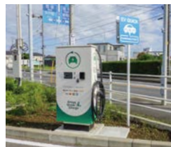
設置されたEV急速充電設備