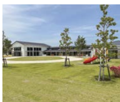
統合された「ふたば保育所」