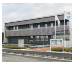
完成した東部分署庁舎