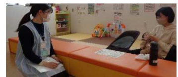
栄養士との 離乳食相談