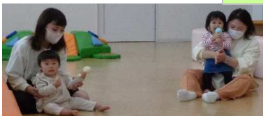
oh! our ハニカム