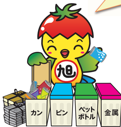
旭市イメージアップキャラクター「あさピー」