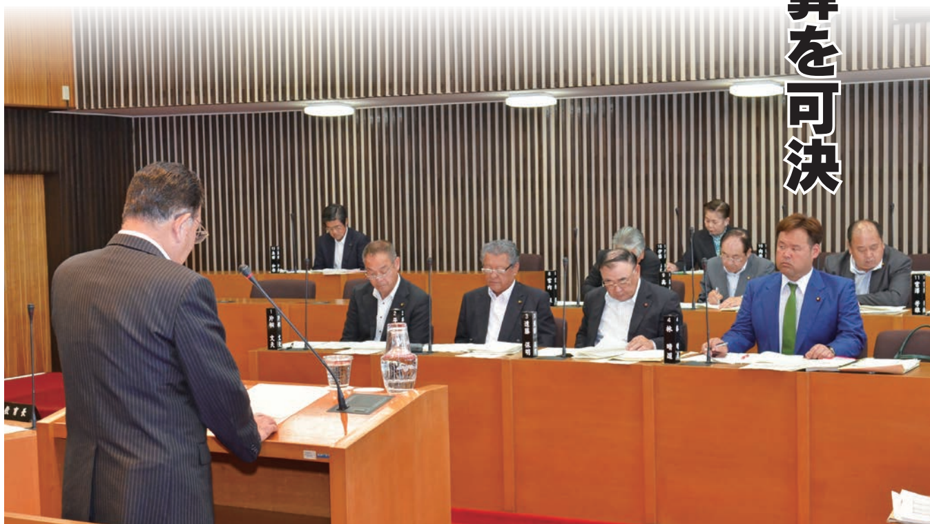
定例会初日、17名の議員に対して提案理由並びに政務報告を述べる明智忠直市長

答 母親が養育費を送っている場合は、母親が対象となり、住んでいる市町村から給付金が支給される。母親が養育費を送っていない場合、祖母が児童扶養手当を受給している、かつ未婚であれば、祖母が対象になる。