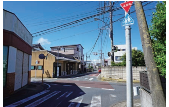
中央小学校正門北側の交差点