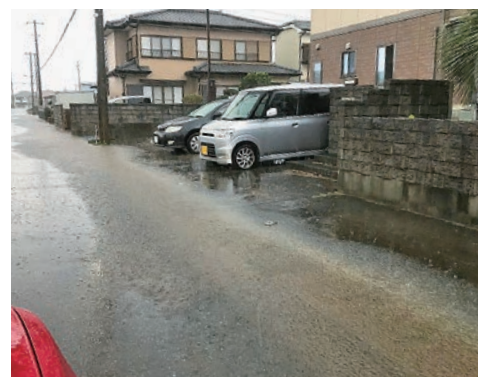
嚶鳴小学校付近の冠水した通学路