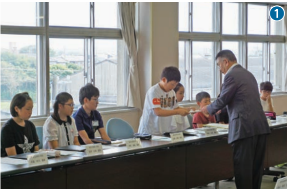
市長から子どもたちへ任命書が手渡されます 22名が子ども議員に任命されました