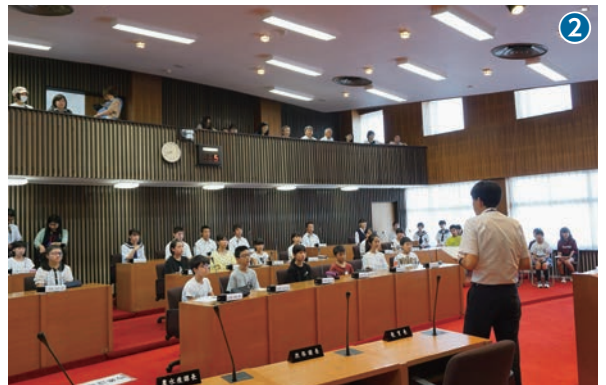
議場内のルール、質問の仕方など説明を受けます