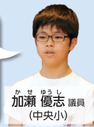
かせ ゆうすけ 加瀬 優志 議員 (中央小)

児童遊園に関しては、基本的には地元の区で、月1回以上遊具の点検、草刈りや清掃などを行っています。また年1回、市が全ての遊具の一斉点検も実施しています。皆さんからのご意見や要望は市のホームページから問い合わせができるようになっています。