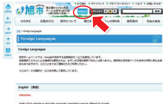
外国語表記対応している旭市ホームページ「TRANSLATE」をクリックすると外国語選択へ