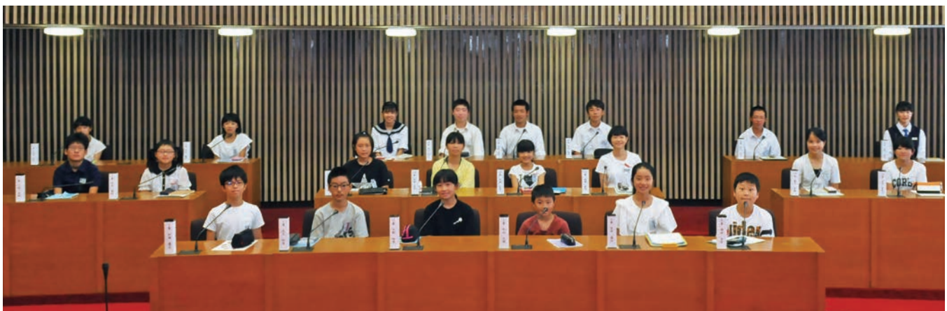
大人の議員さんからの堂々とした質問や提言を行った子ども議員の皆さん