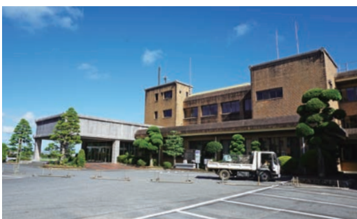
干潟公民館の機能を移転させるための改修工事中の干潟支所

答 確かに企業の信頼性、社会 性などの項目で、市内の業 者が有利になる部分もあるが、 全てではない。