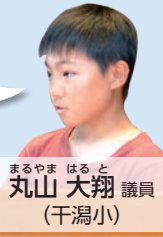
まるやま はると 丸山 大翔 議員 (千潟小)

災害の備えとして避難場所を事前に決めること、防災グッズを準備しておくことが大切だと思います。旭市では住民の防災意識を高めるために、どのような取り組みをしていますか。