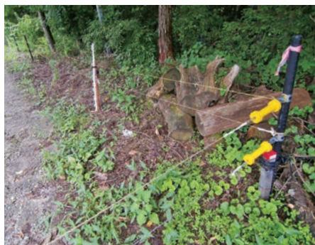
ワイヤーに触れた動物に電気ショックを与える電気柵

問 近隣市町と地域連携をするため、連絡会議を実施するということがあったが、どのような話し合いがあったのか。