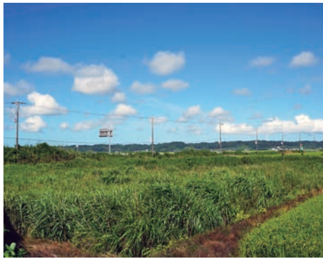
雑草が繁茂している耕作放棄地

答 農業後継者に対する支援は、規模の大小を問わず、長年考えているが、なかなかいいアイデアが見つからない。いろいろな方々の知恵を借りながら、旭市にふさわしい農業後継者対策推進をやっていききたいと思っている。