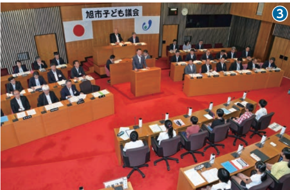
市長からの激励を受けて、いざ本番へ