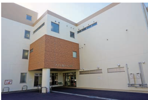
近隣で無料低額診療を実施している九十九里ホーム病院(匝瑳市飯倉)

答 無料低額診療施設は、低所得者、要保護者、ホームレス、DV被害者などの生活困窮者を支援するための施設であり、今のところ本市にはないが、県内では23カ所ある。このような医療機関の情報も収集し、施設の有効性について、関係各課と連携をとりながら対処していく。