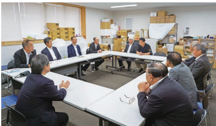
道の駅の会議室で意見交換

委員 マンパワーが足りないことも一つの課題だと思うので、働く方々の雇用面の改善も願いたい。話を聞いてみると、この道の駅のポイントをよく理解しているように感じる。のびのびと運営を任せられるような体制にして、存分に能力を発揮していただきたい。