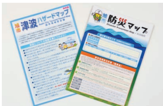
市が作成する防災に関するマップ