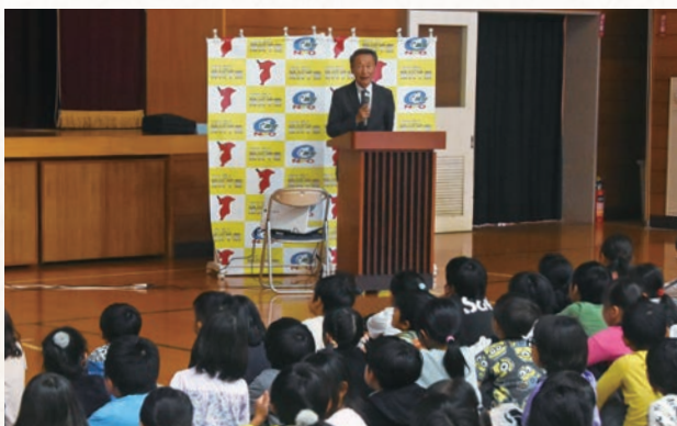
飯岡小で行われた出前授業

津波を経験して一番反省している点は、大津波警報が出ても、堤防を超える津波は来ないと思って逃げなかったことです。私は昭和35年のチリ津波を経験し、津波が堤防を超えなかった記憶がありました。震災当時も大きな津波は来ないと考え、避難しなかったため津波に流されてしまいました。そのため講演では、堤防を超えた大きな津波が来たこと、津波は何度でも押し寄せることを必ず話すようにしています。講演の最後には、自分が津波に流された経験を基に「どんなことがあっても生きること、生きてみることを第一に考えて、これからの人生を歩んでください」と話しています。