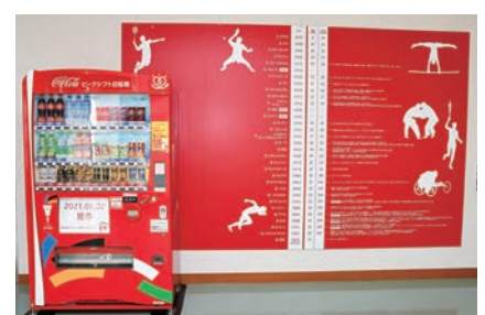
目を引く真っ赤なデザイン

昨年8月にコカ・コーラボトラーズジャパン株式会社と締結した協定に基づき、聖火リレーがデザインされた自動販売機が総合体育館2階に設置されました。その後ろには、オリンピックの歴史や主な日本人選手の活躍を紹介する、オリンピック年表を掲載しています。