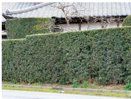
市内で見られるマキの塀

昭和26年に現在の旭郵便局に奉職して以来、八日市場郵便局長などを歴任し、退職されるまでの40年余の永きにわたり郵政事務に精励されました。在職中は、常にお客さまに寄り添った職務姿勢が評価され、郵政局長表彰をはじめ数々の表彰を受賞されました。また卓越した指導力の下、職員の育成を率先して行うなど、郵政事業の発展に多大な貢献をされました。