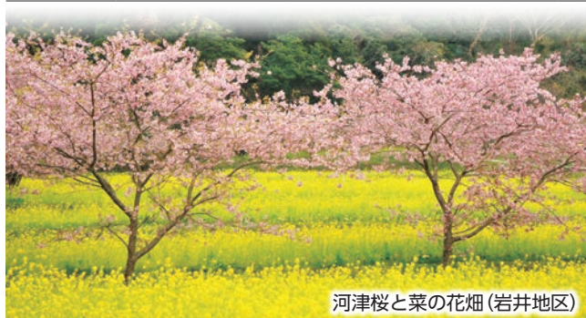
河津桜と菜の花畑(岩井地区)