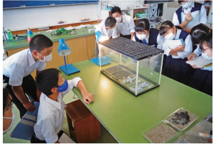
季節風がどのような仕組みで起こるかを実験で観察

干潟中では、干潟地区から飯岡刑部岬まで続く下総台地の地層観察や、気象についての実験などで、自然に触れ、体験しながら探究する子どもの姿勢が評価され受賞しました。