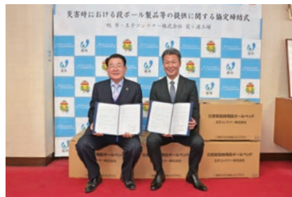
奥田工場長(右)と協定を交わす

避難所での環境改善や感染症対策として、災害時に段ボール製のベッドと間仕切りの提供を受ける協定を、王子コンテナ株式会社と締結しました。ベッド用に補強された9個の段ボール箱の上に天板を載せると、長さ約2メートル、幅約90センチのベッドが完成します。