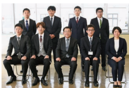
出席した新規就農者と市長ら

市内で新たに農畜産業に従事する若者を激励する「羽ばたくルーキー農業者激励会」を開催。20代から30代の7人が出席し、就農のきっかけや就農して感じたことを発表しました。家族で農業を営んでいる参加者は「これから頑張って規模を拡大したい」と意気込みを話しました。