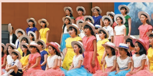
春の訪れを告げる合唱団の歌声