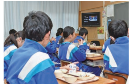
動画に見入る生徒たち

新型コロナウイルス感染防止対策として、会話をせずに給食を食べている市内の小中学生に、少しでも給食の時間を楽しんでもらおうと、動画が校内放送されています。動画はザンビア共和国の文化などを、JICAの海外協力隊員が、現地の映像や体験を基に紹介しています。