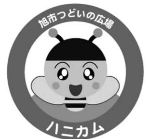
▲ハニカムのマスコット