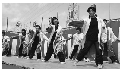
▲昨年のステージイベントの様子