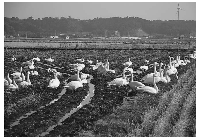
▲約100羽のコハクチョウがのんびりと日なたぼっこ

昨年に続き、今年も萬歳地先の田園地帯にコハクチョウが飛来しました。干潟八万石を訪れた約100羽のコハクチョウは暖かな日差しの中、のんびりと日なたぼっこ、餌をついばんだり、羽を休めたりしていました。市役所には「新聞で知って、市外からコハクチョウを見に行きたい」などの問い合わせもあり、現地では写真を撮る人の姿なども見られました。