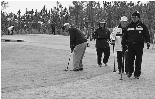
▲ナイスショットの後は会話も弾みます

年齢を問わず楽しめるパークゴルフで親睦と交流を深めようと、第1回旭市福祉協会理事長杯争奪パークゴルフ大会が2月7日、あさひパークゴルフ場で開かれました。当日は、25組99人の男女がプレー。「あーっ、入る、入る」「ナイスショット」の声がコースのあちらこちらから聞こえるほど、参加者の調子も上々のようで、なんと10人の方がホールインワンを達成しました。