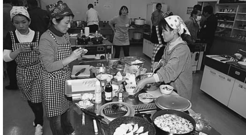
▲主食からデザートまでいろいろな料理が登場（春菊・パセリ料理コンクール）

県内第1位の農業産出額を誇る旭市。ここで作られる野菜をもっと食べてもらおうと、いいおかユートピアセンターで料理コンクールが開かれました。1月24日のキュウリ料理コンクールには、小学5年生を含む7組が、また2月7日の春菊・パセリ料理コンクールには10組が出場。あっと言わせるアイデアいっぱいの料理で、その腕前を競いました。審査員を悩ませた結果、次の方々に最優秀賞が贈られました。