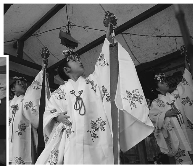
▲優美な衣装での稚児の舞い