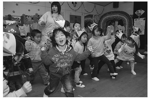
◀元気いっぱい「まめまき」の歌を歌う子どもたち

節分の日の2月3日に、三川保育所の子どもたち104人が、豆まき会を行いました。豆まき会には、入所前の子どもと保護者で作る、ひまわりキッズサークル25組も参加して、みんなで紙芝居を見たり、歌を歌ったりしていました。すると突然鬼が教室へ入って来ましたが、子どもたちは、はらはらした表情を見せていましたが、「みんなと遊びたい」という心やさしい鬼に一安心、一緒にゲームをして楽しんでいました。最後に、袴をまとった年長の子が、舞台から豆やお菓子をまくと、年少の子どもたちが一生懸命拾っていました。