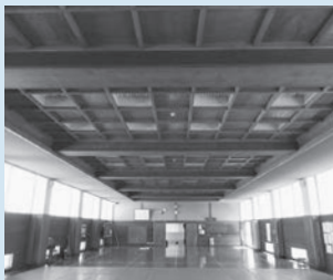
二中武道場の対策前

武道場の天井の対策として、重量のある天井を撤去した後、建築基準法に適合する軽量な天井に改修し、照明器具にも落下防止対策をしました。耐震対策に加え、照明器具のLED化をすることで、明るさも増しました。