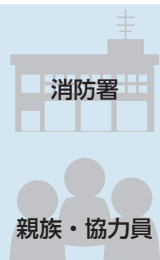
消防署 親族・協力員

看護師や保健師などの有資格者が常駐する相談センターは、24時間365日対応しています。