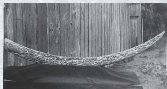
ベルギーに買い上げられた九十九里浜地引の図

このほかにも、柿本人麿像、恵比寿・大黒像、五百羅漢、九十九里浜地引の図などが有名です。その作品の中でも、長さ2メートル余りの象牙彫りの大作である九十九里浜地引の図は、ベルギー政府の要望によって買い上げられ、両国親善に大きく貢献しました。