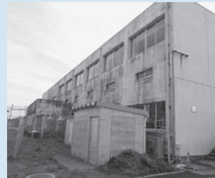
二中校舎の対策前

落下防止対策として、外壁面に発生したひび割れやはがれを補修する外壁改修工事を行い、校舎周辺の安全を確保しました。塗装で仕上げることで、校舎の景観も良くなりました。