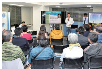
体験談を話す移住者

東京都千代田区にあるふるさと回帰支援センターで、移住を検討する人を対象に「ちば移住セミナー千葉のとっぴずれで暮らす」が開催。旭・銚子・匝瑳の三市に移住した市民がそれぞれの移住の経緯や体験談、生活ぶりを話したほか、各市の職員が移住支援事業などを紹介しました。