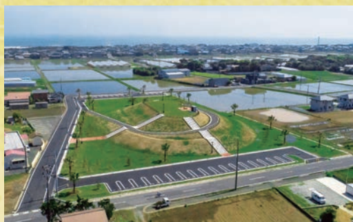
3位/築山が整備された日の出山公園