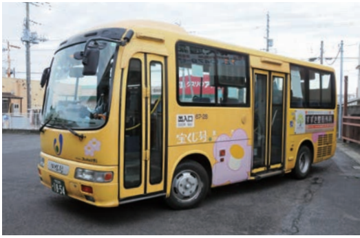
市内を走るコミュニティバス