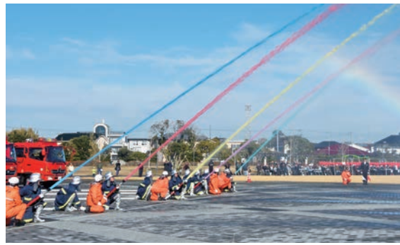
消防団員らによる一斉放水(昨年)

で守りませんか。 対象／市内に居住または勤務し、18歳以上の健康な男性 旭市消防本部総務課消防団班(☎63・5355)