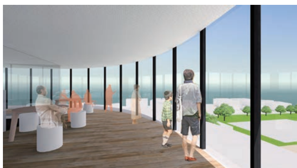
まちを一望できる「屋上塔」のイメージ

建設地／旭市ニの2132番地 建築面積／約3、700㎡ 延床面積／約12、900㎡(地下階約2、250㎡含む) 構造形式／鉄骨造(耐震構造)