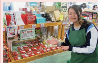
さまざまな品種のイチゴが並び