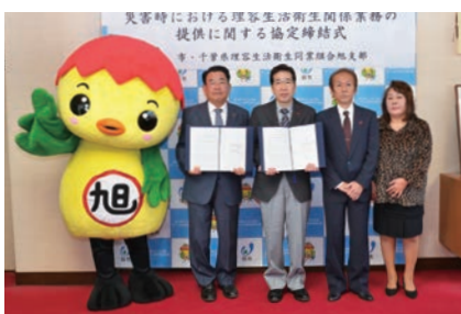
協定の締結で被災者を支援

災害で避難生活が長期化した場合に、避難者への散髪などのサービスを提供し、衛生環境の向上や心身のリフレッシュを図ることを目的に、市内52店舗からなる千葉県理容生活衛生同業組合旭支部と協定を締結しました。同組合が東日本大震災で散髪を行ったことを契機に県内での締結が進んでいます。