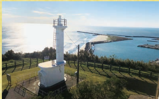
1位/恋する灯台に認定された飯岡灯台