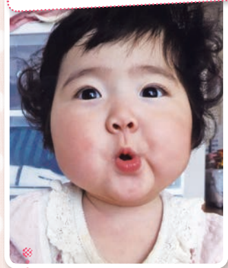
もえ 萌ちゃん 平成29年10月27日生 [後草]