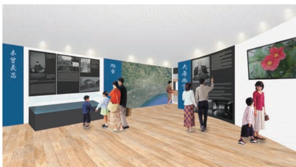
市の偉人などを紹介する「企画展示スペース」のイメージ

階数／屋上塔、地上5階、地下1階 高さ／約26m 駐車台数／167台(来庁者用100台、公用車用67台) 〈建設スケジュール〉 契約／平成31年3月(予定) 建設工事／契約締結後、2020年12月(予定) ※くわしい内容は市ホームページで見ることができます。 利用者を迎える 開放的な低層階 吹き抜けとガラスを多く使用した開放的な低層階と、機能を集約したコンパクトな上層階で構成します。 1階には市の歴史や偉人の企画展をはじめ、市政・観光情報を発信する場や、各種発表会、演奏会、税の申告相談、期日前投票など、幅広く利用できる市民活動の場を配置します。屋上塔には市内を一望できる展望室を設けます。