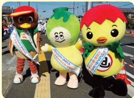
ランナーと ハイタッチ!

ぼくの名前は「あさビー」。市のイメージアップキャラクターとして、いろんなイベントやキャンペーンに参加して市のPRをしています。ぼくを応援してね!