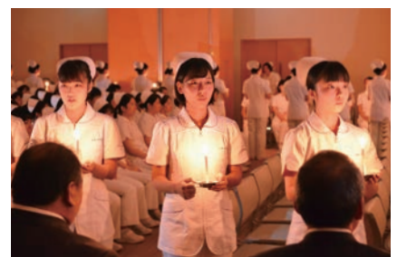
ろうそくを手に医療への献心を誓う

今年の4月に旭中央病院附属看護専門学校に入学した看護学生60人が、本格的な実習のスタートを前に戴帽式に臨みました。看護師の象徴であるナースキャップを与えられた学生は「心のこもった看護を実践し、くじけそうになったら今日の戴帽式を忘れずに頑張っていきたい」と決意を語りました。