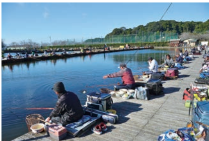
絶好の釣り日和(長熊釣堀センター)

恒例の秋のヘラブナ釣り大会が、袋東ため池と長熊釣堀センターで開催されました。会場には市内外から多くの釣り人が訪れ、互いに腕を競い合いました。各優勝者は以下のとおりです(敬称略)。