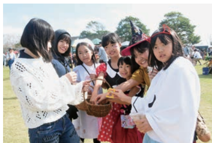
お菓子をもらい笑顔の子どもたち

地域の魅力を知ってもらおうと、地元の若き経営者たちによるイベントが袋公園で開催。会場では食べ物や雑貨などの販売、ステージでのダンスなどが行われました。各ブースには行列が絶えず、ハロウィーンにちなんで子どもたちにお菓子が配られるなど、会場は多くの笑顔に包まれました。