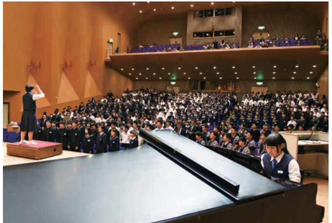
中学生たちの歌声がホールに響く

今年のテーマは「旭の絆 永遠に続け 道を彩る 5色の輝き」。各学校による合唱や演奏、ダンスなどの発表が行われると、会場を埋め尽くした中学生から大きな歓声と拍手が送られました。最後は参加した中学生全員で合唱が行われ、互いに絆を深め合いました。