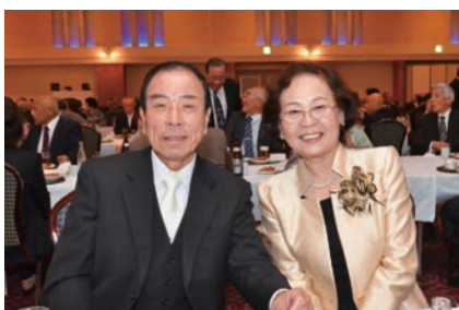
笑顔で金婚を迎える

結婚50周年を祝う旭市合同金婚式が開かれ、市内59組の夫婦が出席しました。式では市長や来賓から祝いの言葉や記念品が贈られ、昭和、平成と二つの時代を共に歩んできた参加者を祝福しました。祝宴では舞踊やお囃子などが披露され、祝いの場を盛り上げました。