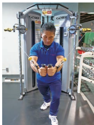
ブラボーコンパクト