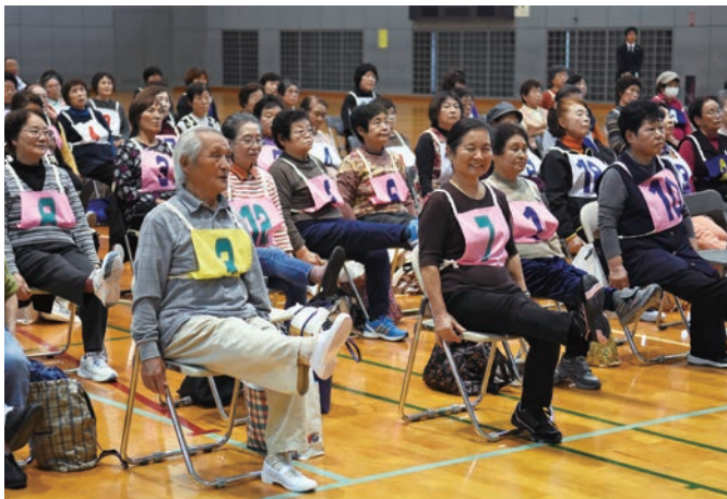
椅子に座って手軽に体操