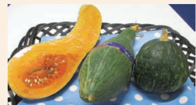
食べ頃のカボチャが並び