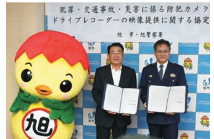
協定書を手に明智市長(中)と羽賀署長(右)

市民生活の安全安心確保のため、市が設置する防犯カメラや公用車に搭載したドライブレコーダーの映像情報を、旭警察署の犯罪捜査や交通事故捜査などに活用する協定を結びました。市の防犯カメラは169台、公用車のドライブレコーダーは107台となり、今後の防犯対策などに役立てます。