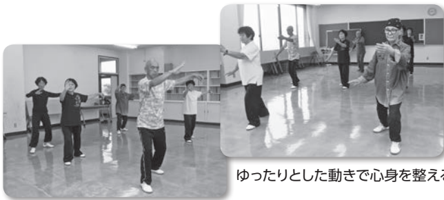
ゆったりとした動きで心身を整える

「健康のため」「ボケの防止に」「台湾の公園でやっているのを見掛けて始めたいと思った」など、始めたきっかけはそれぞれですが、みんな週に1度の活動を楽しみに集まっています。一緒に活動してくれるメンバーも募集していますので、興味を持った人は見学に来てみませんか。