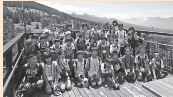
北八ヶ岳展望台で記念撮影

遠くを見渡すと、日本アルプスの山々が連なっていました。どこまでも続く山々と青い空を見上げながら、海とは違った自然の雄大さを感じることができました。