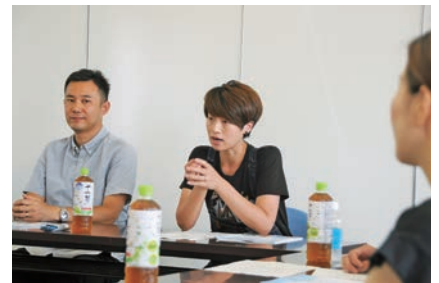
旭の印象について話す参加者

旭に移住してきた人やUターンした人、ずっと旭に住んでいる人など、30代～40代の市民7人による、まちづくり座談会が市役所南分館で開催されました。座談会ではそれぞれの立場から、旭の印象や良いところなどについての意見交換が行われたほか、まちづくりについての提案がされました。