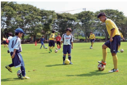
ミニゲームでボールを取り合う

ジェフユナイテッド市原・千葉レディースU-15の選手13人が、選手育成の一環として農家に宿泊しながら、農業体験などを行いました。この日、スポーツの森公園ではスポーツ少年団などを対象にサッカー教室も行われ、子どもたちと一緒にボールを追いかける選手の姿がありました。