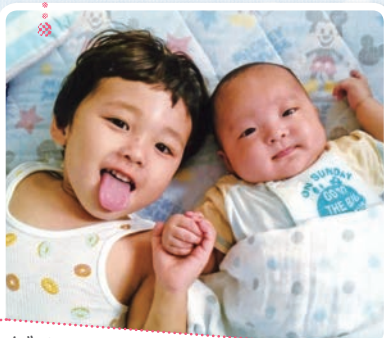
ぼくに弟ができたよ！ 早く一緒に遊びたいな。