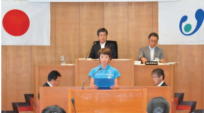
壇上で質問をする子ども議員