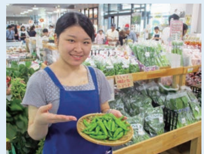
旬のシシトウをどうぞ