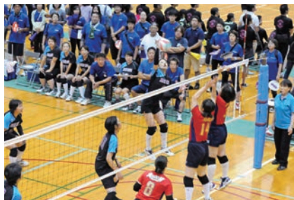
2枚ブロックをかわし攻撃する

PTAバレーボール大会が総合体育館で開催されました。20チームが3ブロックに分かれて競い合い、干潟小、共和小、矢指小がそれぞれ優勝しました。会場では応援に駆け付けた仲間や家族から、盛大な応援が送られていました。3チームは10月14日(日)に開催される東総大会に出場します。