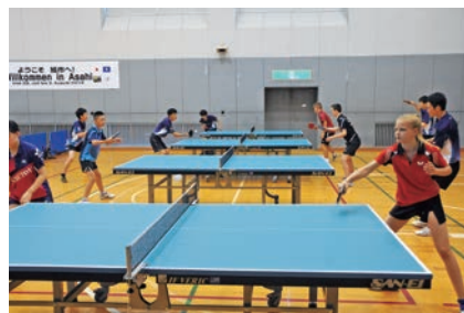
ドイツ選手との交流練習

ドイツデュッセルドルフ市との卓球交流事業が、総合体育館で開催されました。ドイツから8人の選手と2人のコーチを迎え、歓迎レセプション、県内の高校生たちとの交流練習や練習試合が行われました。また市内外の施設見学や書道体験など、日本文化にも触れました。