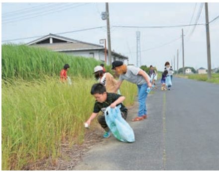
地域の皆さんによるきれいなまちづくり