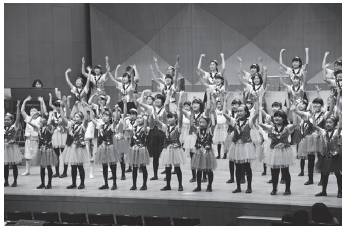
春の訪れを告げる子どもたちの歌声

特別出演では創立50周年を迎えたみどりコーラスが出演し、歌劇「カルメン」などが披露されました。