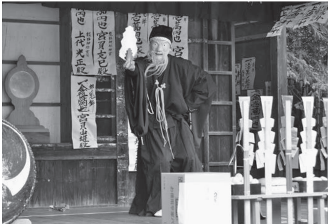
伝統の神楽を奉納