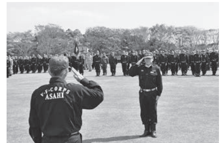
団長への人員報告

消防団による規律訓練がスポーツの森公園で行われました。新たに辞令交付を受けた新入団員90人を含む767人が参加し、団員として基本動作となる整列や敬礼、方向転換などの訓練をしました。消防署員の指導を受けた団員たちは、統制の取れた動作を身に付けていました。