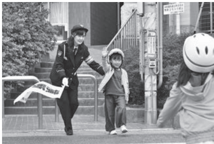
横断歩道を渡る児童

市内の小中学校で交通安全教室が実施され、旭市交通安全指導員による道路の歩き方や、自転車のルールについての指導が行われました。萬歳小では入学したての新1年生が、指導を受けて実際に学校の周りを歩き、安全を確認をして、横断歩道を渡る姿がありました。