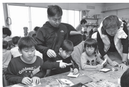
一人で上手にできるかな

旭少年少女発明クラブ開始式が、青年の家体育館そばの発明クラブ工作室で行われ、第36期生26人の活動がスタートしました。この日は、保護者と一緒にCDやビー玉などを材料にしたこま作りも行われ、こまを作り上げた生徒は「今後は電気で動く工作にも挑戦したい」と話していました。