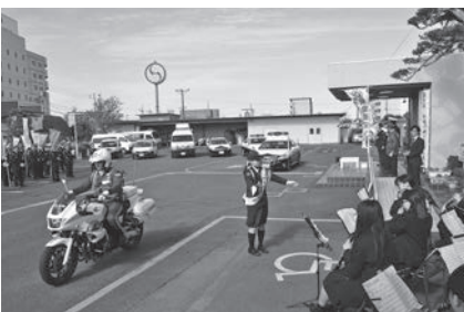
旭農業高等学校の吹奏楽に合わせて出動