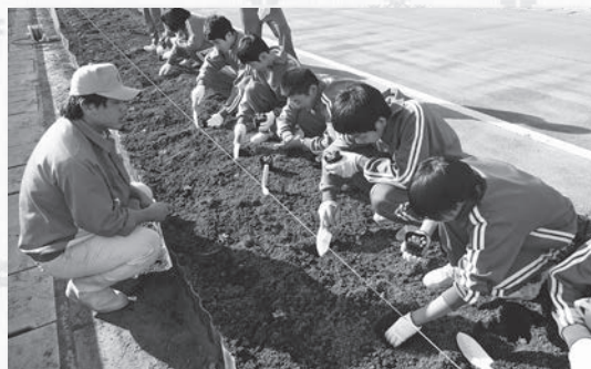
高校生から指導を受けながら植え込み作業

干潟中は全校生徒が149人でとても少ないですが、このように生徒一人一人が全ての行事に対して、149的に活動する活気ある楽しい学校です。