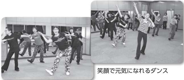
笑顔で元気になるダンス

ダンスをしていると自然と笑顔になり、元気になります。楽しい仲間と出会えて、毎週会えるのがとても楽しみです。始めてから性格が明るく前向きになった会員や、ダイエットに成功した会員もいます。興味を持った人は見学に来てみませんか。男性の参加も大歓迎です。