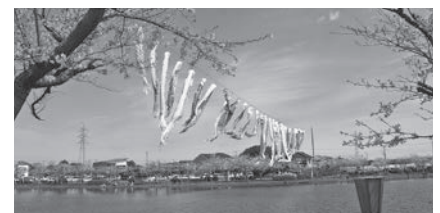
袋公園に舞うこいのぼり