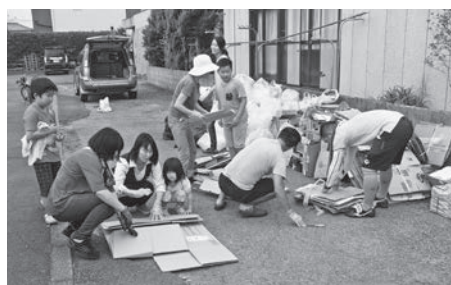
毎月集団回収を実施している瀬道子供育成会

対象 ／地域住民により10世帯以上で構成された団体 奨励金 ／1kg当たり5円(年度内20万円まで)