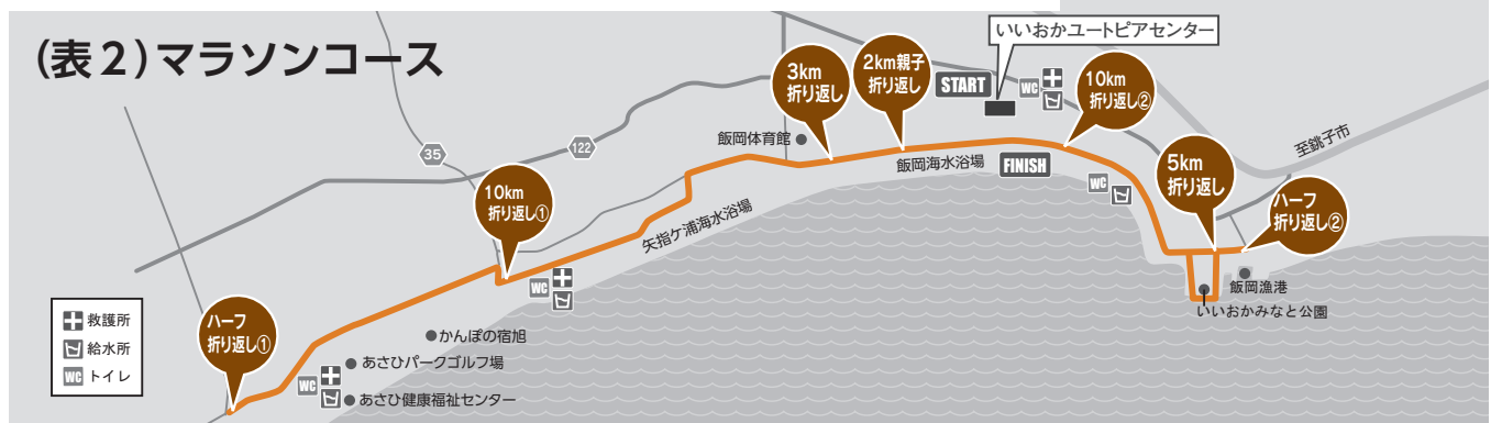
(表2) マラソンコース