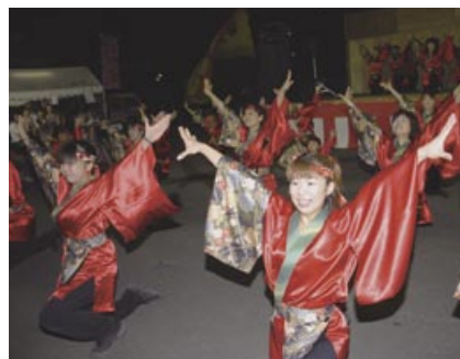
▲よさこいソーラン