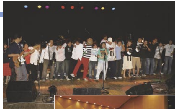
◀ 出演者が勢ぞろい

出演者やボランティアスタッフによる手づくりの音楽祭「2006天の川ライブフェスティバル」が8月6日、東総文化会館大ホールと小ホールを会場に開かれました。大ホールでは小学生の吹奏楽を始め、マンドリン、大正琴、民謡、お囃子など10団体が出演。演奏が終わると会場は大きな拍手に包まれていました。また、小ホールでは「星者の行進」と題して6組のバンドが出演。最後は出演者全員による演奏が行われ、会場全体で盛り上がりしました。