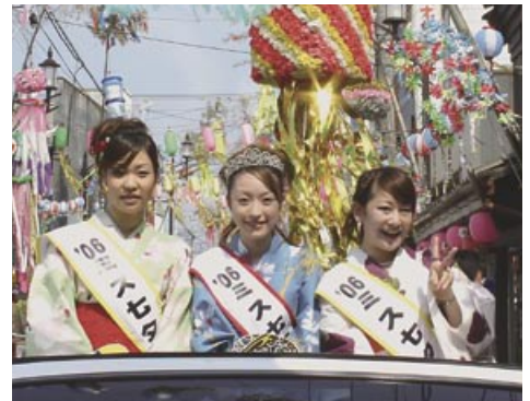
▲ミス七夕パレード