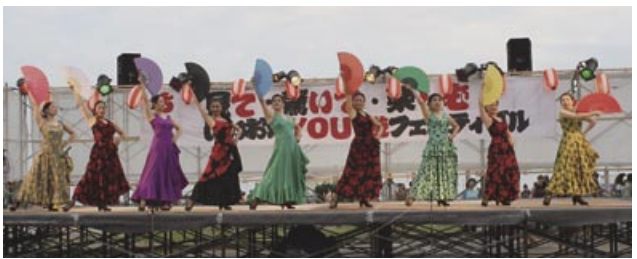
▲フラメンコ「ラスボニータス」