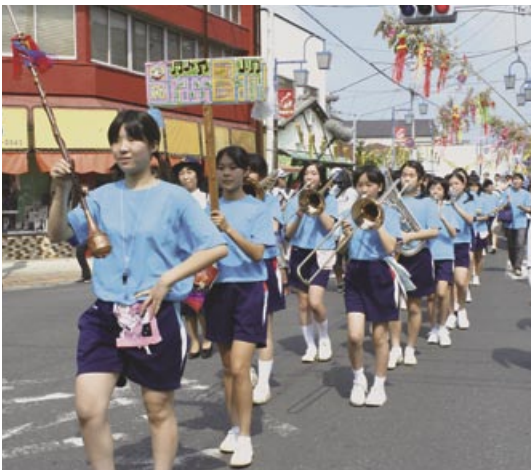
▲旭二中吹奏楽部パレード

色彩豊かな七夕飾り。大勢の人が参加した催し。8月6、7日に行われた七夕市民まつりは12万人の人出でにぎわいました。