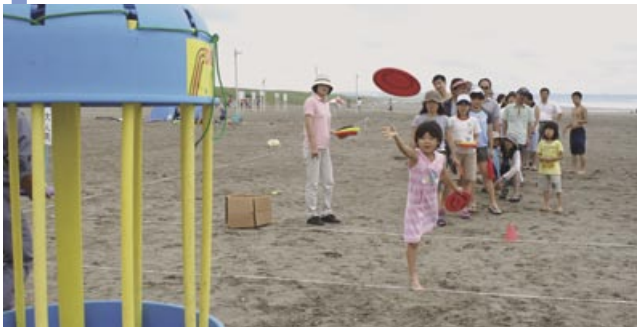
▲ディスクゴルフ大会