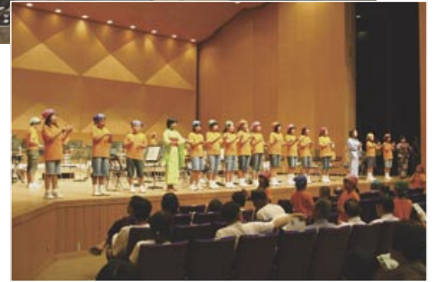
▶ 手話を交えた歌も披露 (三川小学校)