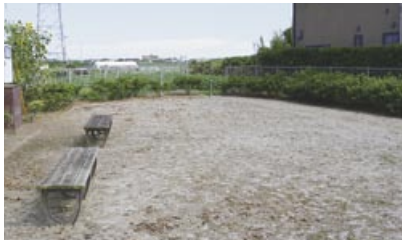
▲江ヶ崎地区の公園