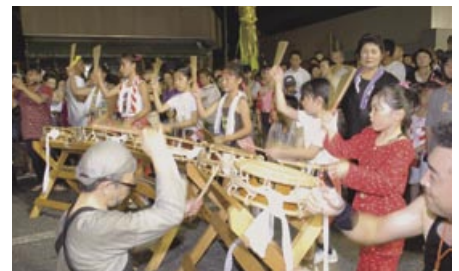
▲子どもたちも見事なばちさばき