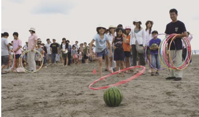
▶スイカ輪投げ大会