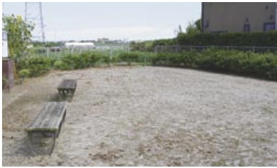
▲江ヶ崎地区の公園