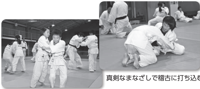
真剣なまなざしで稽古に打ち込む

メンタルが大切な競技なので、いざというときに力が引き出せるようになり、最近では近隣の大会で好成績を挙げられるようになりました。