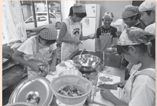
宿舎での食事作り

食事は全て自分たちで作りました。1日目は夕食のハンバーグとシチューで、旭市産の野菜や米粉、肉をふんだんに使った料理です。旭市まちおこし産品推進協議会の皆さんが、調理の方法を丁寧に教えてくれました。子どもたちも、ほかの学校の友達が出来たことで交流が深まり、良い思い出になったようです。自宅に帰ってから