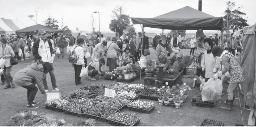
特産品を求める人でにぎわう会場