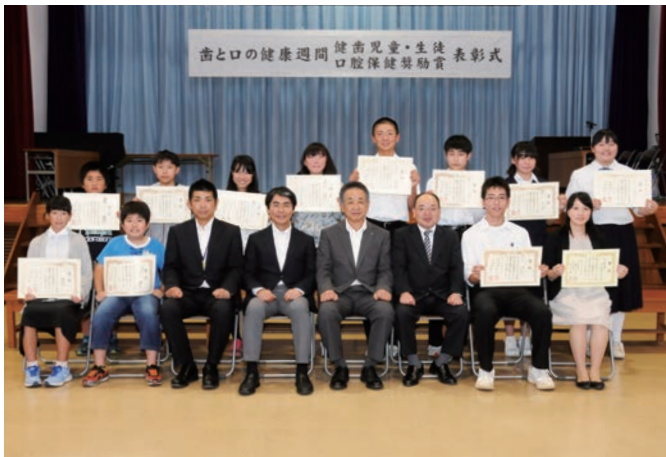
賞状を手にする受賞者