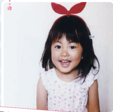
歌うのが大好きな あおいちゃんです。