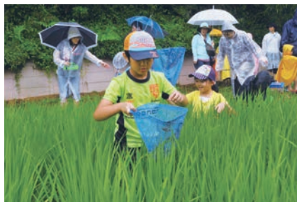
生き物を探す参加者

米作りを通して都市との交流を図る、幽学の里で米作り交流事業の生き物調査が、大原幽学遺跡史跡公園の田んぼで行われました。