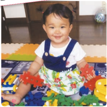
めい 芽愛ちゃん 平成27年5月22日生 [二]