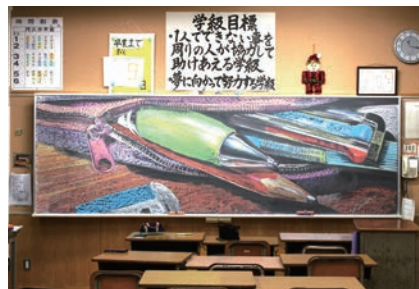
二中での黒板アート作品「ふでばこ」