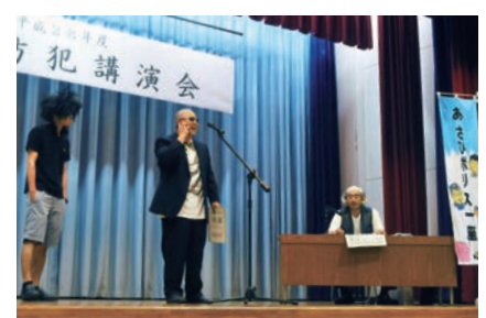
警察官による詐欺防止の寸劇

毎年7月1日の「旭市防犯デー」にちなみ、地域の安全と市民一人一人の防犯意識向上を図ろうと、海上公民館で旭市防犯講演会が開催されました。この日は、現役警察官による犯罪防止の講演が行われたほか、警察官で構成する「あさひポリス一座」が寸劇で被害防止を呼び掛けました。