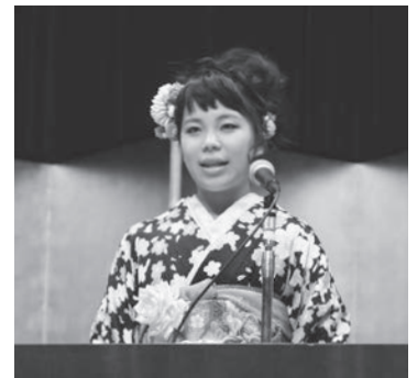
二十歳の思いを伝える