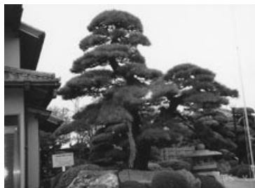
クロマツ (認定番号18) 琴田・芝田克巳さん所有

植木の生産振興を図るとともに、その銘木を広く紹介しようと、平成14年度から始まった「千葉県植木銘木100選」の認定。生産が盛んな旭市でも、2本の植木が認定されています。品位と風格を備えたその姿は、まさに芸術品。皆さんも、ぜひ一度ご覧になってはいかがでしょうか。 問い合わせ先/農水産課農業基盤整備班 (☎68-1173)