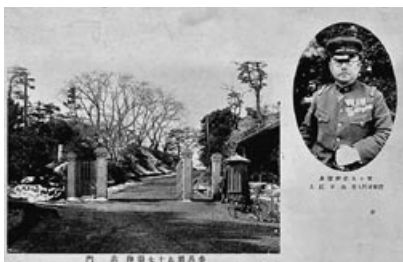
▲佐倉連隊表門と連隊長の絵はがき(昭和期・国立歴史民俗博物館蔵)

開催期間／9月3日(日)まで 開館時間／午前9時30分～午後5時(入館は午後4時30分まで) 会場／国立歴史民俗博物館企画展示室 入館料／一般830円、高校生・大学生450円、小中学生250円 問い合わせ先／国立歴史民俗博物館 (☎043-486-0123)