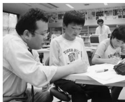
▲プロ記者と一緒に新聞づくり

この活動を通して、学校全体が明るく、楽しく、元気になると信じています。そして、校歌にもあるように、希望に向かって努力する「富浦っ子」として、がんばっていききたいと思っています。