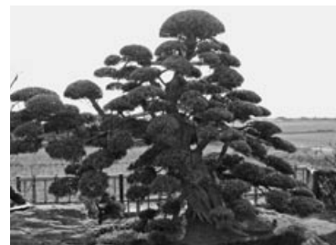
イヌマキ (認定番号24) 入野・岩崎良雄さん所有