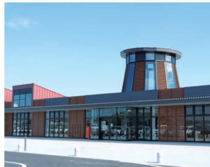
道の駅季楽里あさひ