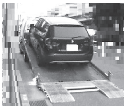
差し押さえ自動車の引き揚げ

千葉県は、自動車税の未納額の縮減のため、11月～平成28年3月を滞納整理強化期間とし、給与、預金、自動車などの差し押さえを一層強化しています。自動車税が未納の場合は、至急納付しましょう。