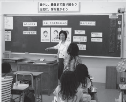
小学校4年生を対象にした人権擁護委員による「人権教室」

激しく変化していく社会において、いじめ、差別、偏見、インターネットによる人権侵害などが後を絶ちません。一人一人が掛け替えのな