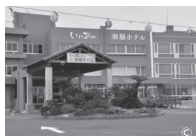
いいおか潮騒ホテルがオープン(7月)