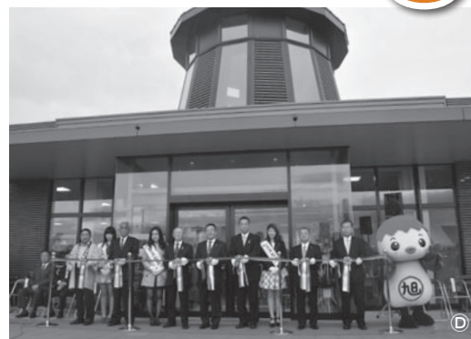
道の駅季楽里あさひのテープカット(10月)