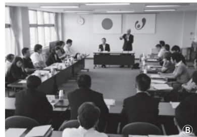
総合戦略懇談会(5月)