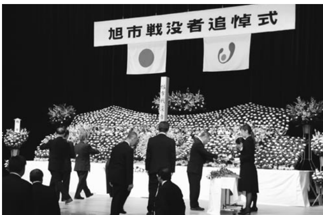
献花をする参列者

東 総文化会館で10月30日、旭市戦没者追悼式が行われ、先の大戦で散華した戦没者1,863柱、戦災によって亡くなった戦災死没者58柱の冥福を祈るとともに、恒久平和の誓いを新たにしました。参列した遺族や関係者など242人は、献花台に白い菊の花をささげ、戦没者を悼んでいました。