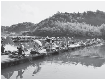
自然に囲まれた長熊釣堀センター

☎ 289-2504 旭市二の5127 商工観光課観光班(☎62-5338・青年の家1階)