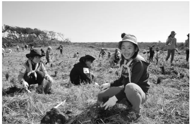
苗木を植える参加者

野中の海岸保安林で10月25日、クロマツ2,000本の植樹が行われました。津波や松くい虫の被害に遭った保安林の再生をしようと昨年からは実施しているもので、市民や青少年健全育成団体など200人が参加。植樹を終えた子どもたちは「10年後、100年後の未来まで大きく育ててほしい」などと話していました。