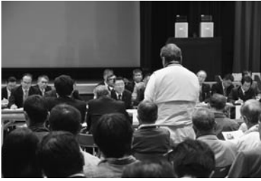
意見を発表する参加者

市長が地域に出向き、市民とまちづくりについて話し合う地区懇談会が、10月5日から市内6か所で開催されました。今年は市の主な事業や平成26年度の決算の説明とともに、地方創生の推進に向けた「旭市総合戦略骨子」の説明が行われ、参加者からは将来のまちづくりに関する提案や市への要望などが出されていました。