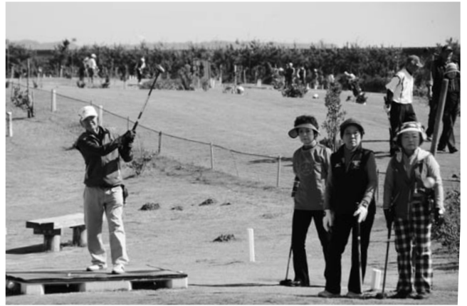
ボールの行方を追う参加者

パークゴルフを通じて交流を図るとともに、市の特産品などをPRしようと10月26日と27日の二日間にわたり、あさひパークゴルフ場で開催された向太陽杯パークゴルフ大会。市内のほか全国各地から訪れた160人の参加者たちは、互いに腕を競い合いました。昼食には旭の食材を使った豚すき丼やポークカレーなどが振る舞われ、笑顔で頬張る参加者の姿がありました。