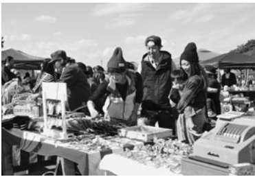
雑貨店など多くの店舗が出店

袋公園で「第6回VILLAGE」が開催されました。来場者にこのまちをもっと好きになってもらえるよう、次の世代を担う若手生産者や飲食店、小売店などが集まって旭の魅力を発信。多くの来場者が訪れる中、ハロウィンの衣装をした子どもたちがスタッフに合言葉を告げてお菓子をもらうなど、会場は笑顔であふれていました。