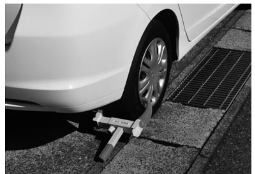
市税の徴収対策に導入されたタイヤロック

税金を納期限までに納付しないと、督促状や催告書を発送します。催促にもかかわらず「相談もなく納付しない」「納税誓約を守らない」などの場合、滞納処分を執行します。滞納処分では法律に基づき、給与、預貯金、生命保険、売掛金、所得税還付金などのほか、自動車のタイヤ