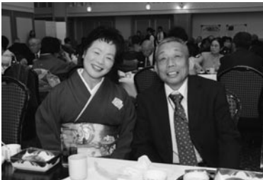
晴れの日を笑顔で

結婚50周年を祝う旭市合同金婚式が開かれ、市内58組の夫婦が出席しました。式では、来賓から祝いの言葉や記念品が贈られ、出席した一組は「共に力を合わせながら頑張ってきた。この日を迎えられることができ感無量です」と話していました。