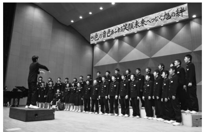
海上中の合唱発表

東 総文化会館で11月6日、市内5校の中学校3年生たちが集い「5色の音色 あふれる笑顔 未来へつなぐ旭の絆」をテーマに、中学校合同文化祭が開催されました。各学校による合唱のほか、琴の演奏、吹奏楽、ダンス、ソーラン節の演舞といったステージ発表が行われ、客席からは大きな声援と拍手が送られていました。