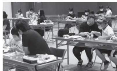
パタパタあさピー作成中

1日は、おもりの力で動く「パタパタあさピー」、8日は、クリアファイルで作ったぜんまいで動く「メリーゴーラウンド」の科学工作に取り組みました。工作では難しい部分もありましたが、おうちの人の力を借りたり、前においてある完成品がどのようになっているかを見にきたりして、完成にこぎつける子どもたちの姿が多く見られました。