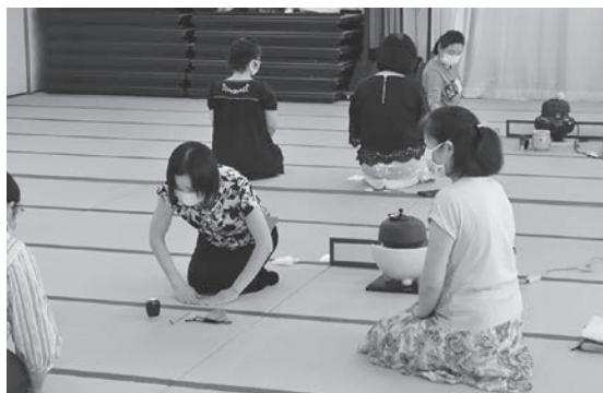
茶道の作法について学ぶ受講生

新型コロナウイルスの影響により、2か月遅れて7月から開講した茶道講座。感染拡大防止のため、受講生は新生活様式に沿った活動をしています。