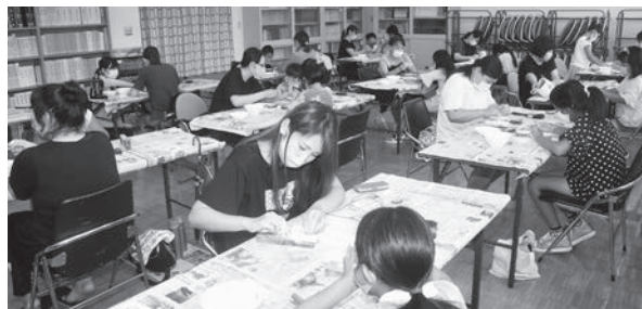
やすりで勾玉を削り出す参加者

例年になく人気となった「勾玉づくり」を8月9日(日)に開催しました。当日は、親子12組27人の参加者が、古代から伝わる日本のアクセサリーづくりに取り組みました。慣れない作業に苦戦する場面もありましたが、親子で楽しく作ることができました。