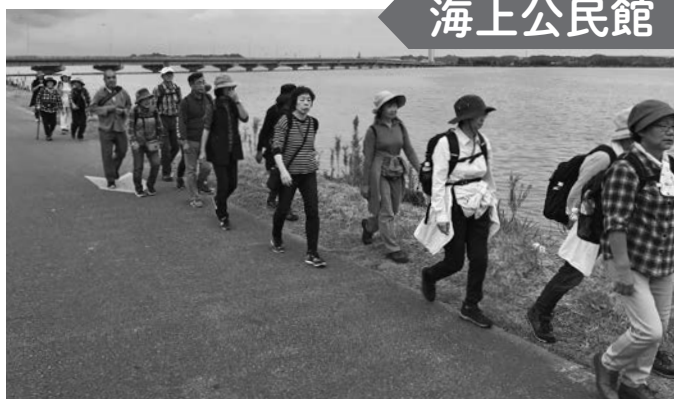
霞ヶ浦湖畔をウォーキングする参加者

昨年10月27日、海上公民館主催講座「秋のウォーキング」で、茨城県霞ヶ浦に出かけてきました。大雨の影響もあり、水位が普段より高くなっていましたが、参加者24人は横断橋を渡る約10kmの湖畔コースを完歩しました。途中、道の駅たまつくりで昼食をとったり、それぞれ友だちとの会話や景色を楽しんだりしました。参加者からは、「とても充実した秋の一日を過ごした」との感想が聞かれました。